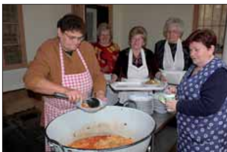
Akik a finom ebédet főzték