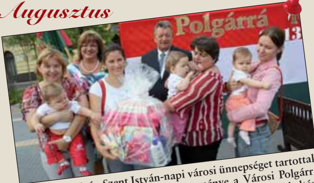
Augusztus 20-án Szent István-napi városi ünnepséget tartottak Nagykőrösön. Ennek egyik jeles eseménye a Városi Polgárrá fogadás volt, mely rendezvény gondolatának életre keltésé dr. Czira Szabolcs polgármester nevéhez kötődik