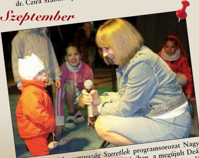
Itthon vagy! Magyarország Szeretlek programsorozat Nagykőrös Város Önkormányzata szervezésében, a megújult Deák téren. A nap sztárvendége Kovács Kati Liszt Ferenc-díjas előadóművész volt, aki Koncz Tibor zeneszerző, zongorista kíséretében adott nagy sikerű koncertet