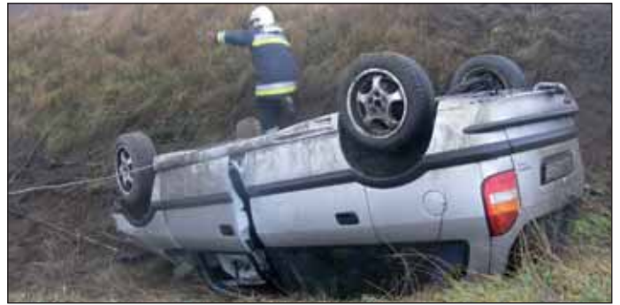
A 441-es úton személygépkocsi árokba hajtott és felborult