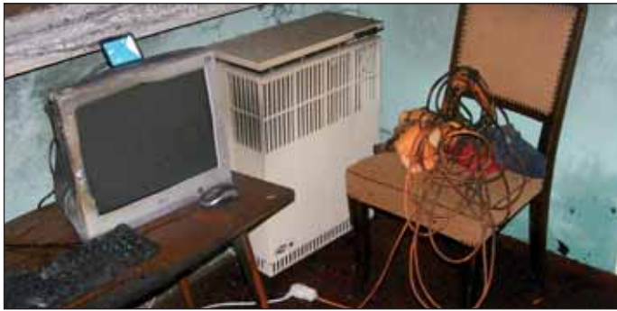
Kocséron lakóépülettűzhöz vonultak a nagykőrösi lánglovagok