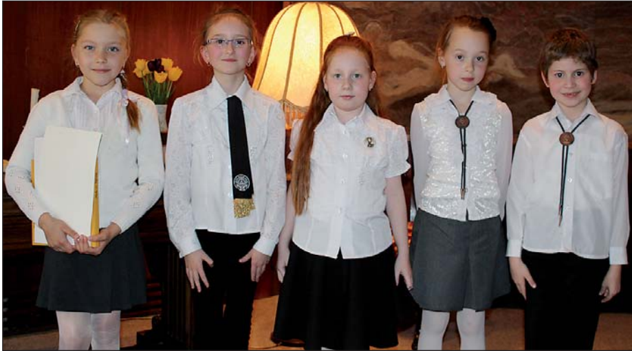
1–2. o. kategória versenyzői