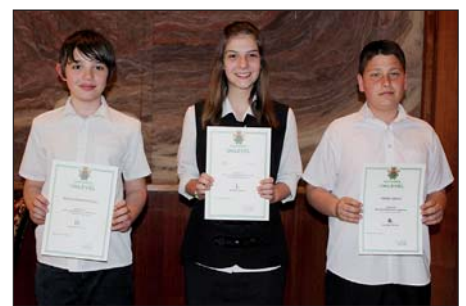
7–8. o. kategória díjazottjai