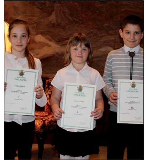
3–4. o. kategória díjazottjai