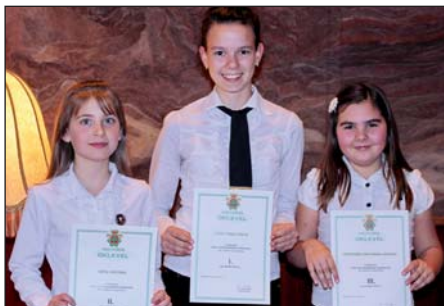
5–6. o. kategória díjazottjai

A további eredményekről a www.nagyko-ros.hu honlapon olvashatnak, a Hírek menüpontban.