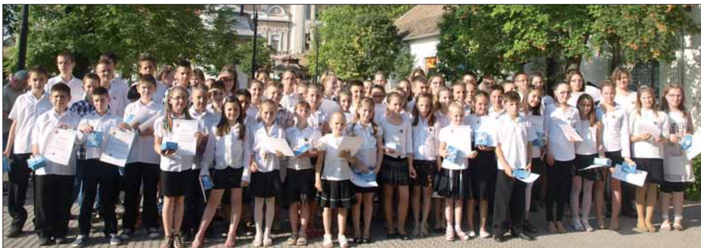
A II. Rákóczi Ferenc Általános Iskola kiváló diákjai