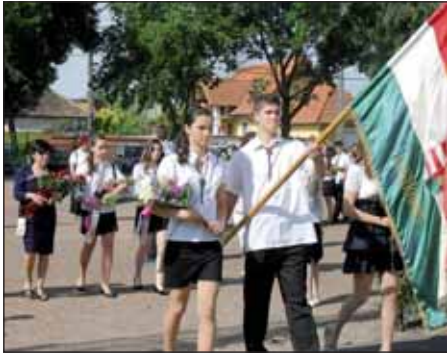
Tanévzáró és ballagási ünnepség a Petőfi iskolában