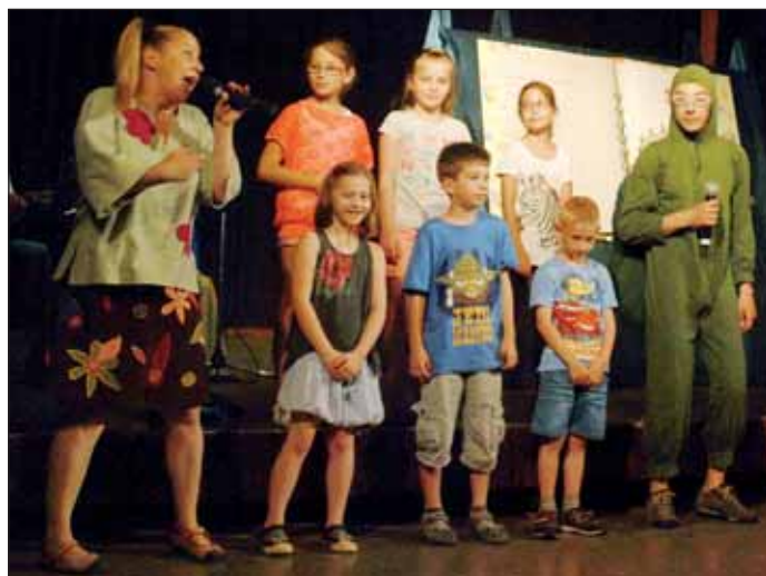
A sok apróság nagyon élvezte a Nagy Mesekönyv című gyermekműsort

A Könyvhét a magyar irodalom és a minőségi könyvkiadás egész Európában páratlan hagyományú rendezvénye, amelyhez egy nap erejéig városunk is csatlakozott. A programok a Deák téren, valamint a Nagykőrösi Arany János Kulturális Központban valósultak meg, ahol az apróságokat délelőtt a Bergengóc Zenegóc Társulat zenés gyermekműsora gyermekkorunk kedvenc meséivel várta, mint a Pom-Pom , Kíváncsi Fáncsi , Nagy-ho-ho-horgász , Micimacskó . A rendezvény középpontjában egész nap az olvasás és az olvasás népszerűsítése állt, s ezt célozta meg az Öt perc kultúra címet viselő programelem is, amely során közel 100 diák egyszerre olvasott fel kedvenc könyvből a Deák téren, majd délután a Brémai Muzikusok című papírszínház-előadást tekinthették meg a gyerekek a téren. Idén is díjazták a gyermekkönyvtár legszorgalmasabb ol-