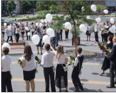
Tanévzáró és ballagási ünnepség az Arany iskolában

A Nagykőrösi Petőfi Sándor Általános Iskola és Kollégium, a Nagykőrösi Kossuth Lajos Általános Iskola, az Arany János Református Általános Iskola, a Nagykőrösi II. Rákóczi Ferenc Általános