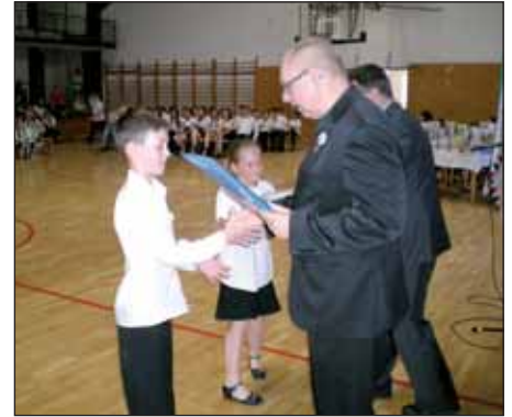
Tanévzáró ünnepség a Kossuth iskolában

Iskola, a Dalmady Győző Óvoda, Általános Iskola és Egységes Gyógypedagógiai Módszertani Intézménye, valamint a Nagykőrösi Kolping Katolikus Általános Iskola tanulói az elmúlt hétvégén búcsúztatták ballagó diákjaikat.