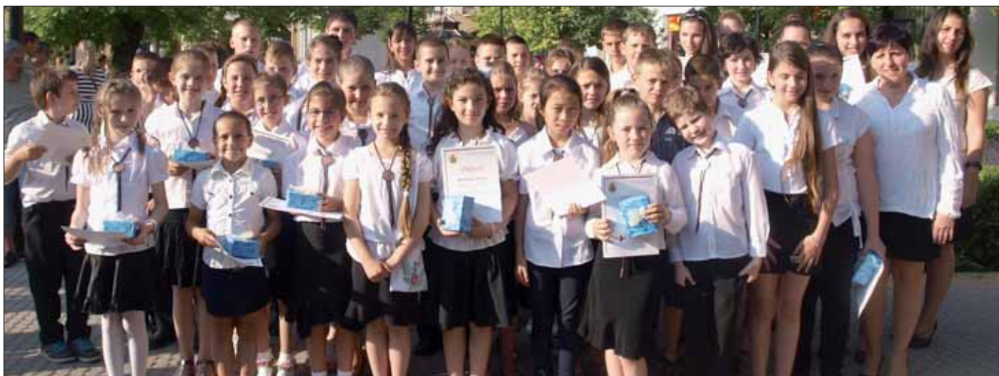
A Nagykőrösi Petőfi Sándor Általános Iskola és Kollégium kiváló diákjai