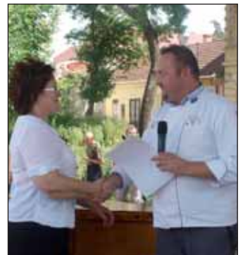
Főzőversenyen szereplő csapatok díjazása