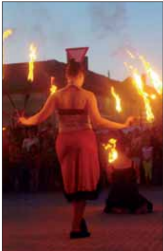
Látványos Tűzsonglőr produkció