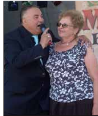
„Jó ebédhez szól a nóta”

Tekintsék meg képgalériánkat a www.nagykoros.hu honlapon, valamint az Önkormányzati Hírek Nagykőrös facebook oldalán!