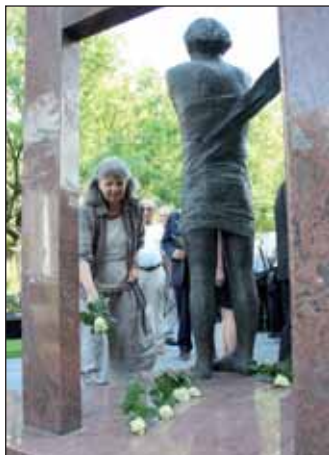
Az emlékezés virágainak elhelyezése