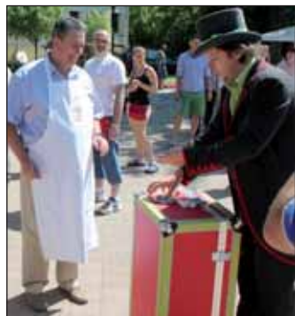
Egy kis bűvésztükrük...