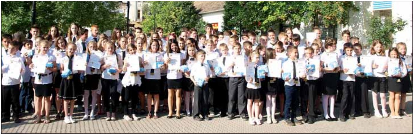
Az Arany János Református Általános Iskola kiváló diákjai