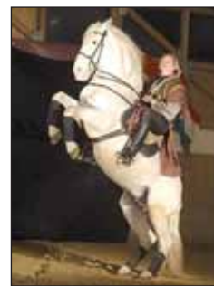
A fotón Pintér Tibor színművész látható PÓKER nevű lovával