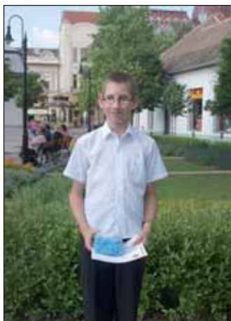
A Nagykőrösi Kolping Katolikus Általános Iskola kiváló diákja