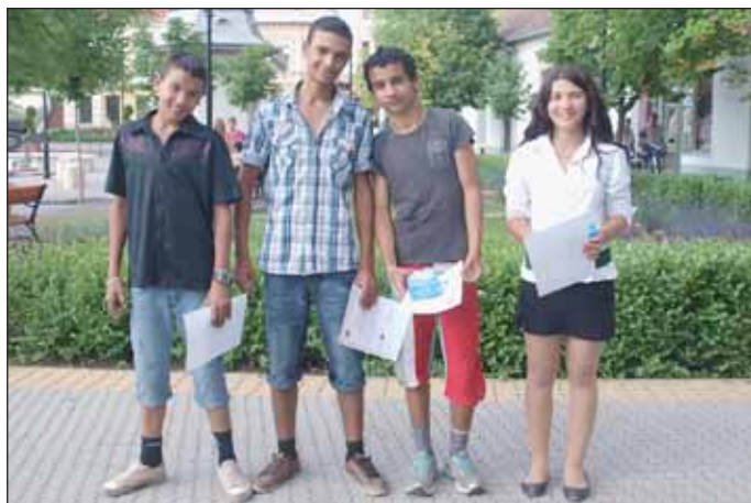
A Dalmady Győző Óvoda, Általános Iskola és Egységes Gyógypedagógiai Módszertani Intézmény kiváló diákjai