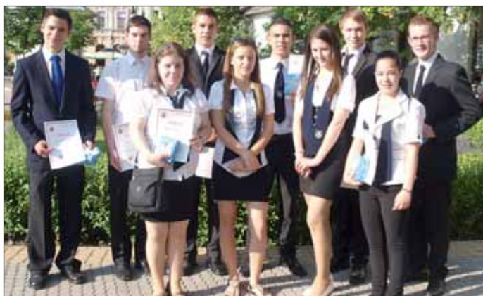
A Toldi Miklós Élelmiszeripari Szakképző Iskola és Kollégium kiváló diákjai