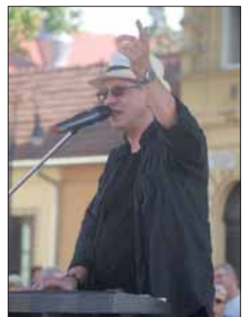
Balázs Fecó fellépése