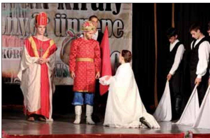
Patkós Irma Színház ünnepi műsora

Városunk alpolgármesterei és települési képviselői segítőkkel együtt a szülők részére átadták a polgárrá fogadott gyermekek számára összeállított ajándécsomagot