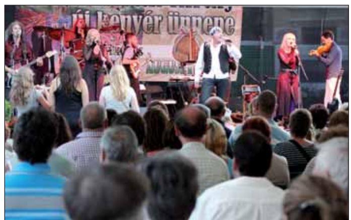
Az Örökség Zenekar élő koncertje