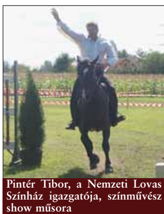
Pintér Tibor, a Nemzeti Lovas Színház igazgatója, színművész show műsora