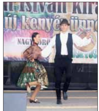
Nagykőrösi Arany János Kulturális Központ és az Izsáki Sárfehér Néptáncscsoport fellépése