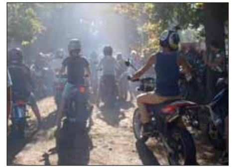
A fotó a 2013-as Nagykőrösi Családi Motoros Napon készült a Cifrakertben

– Az idén is számos helyi vállalkozó és szervezet segítségével valósulhat meg a 7. Nagykőrösi Családi Nap a Nagykőrösi Arany Napok egyik programjaként. A végén, de nem utolsó sorban természetesen