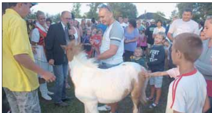
A tombola fődíját, a Bakacsin nevű pónicsikót nagykőrösi lakos nyerte meg