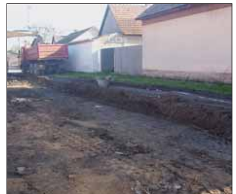
Folyik az útmunka a Csipvári utcában is