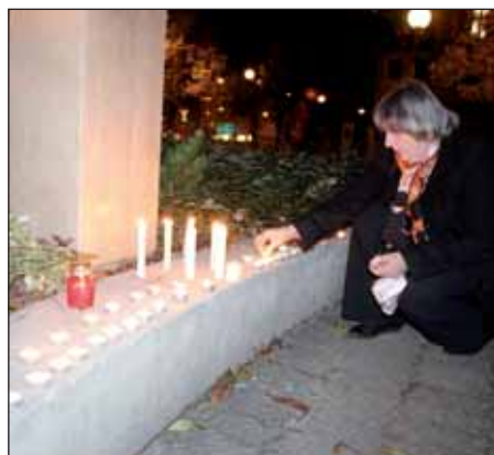
A Barta Margit-emlékműnél elhelyezték a megemlékezés virágait és mécseseit