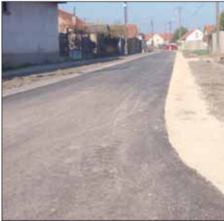
Elkészült az Esze Tamás utca is