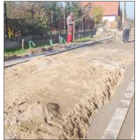
A szegély már kész a Sirató utcában – folyamatos a munka

Már számos nagykőrösi utcában befejezték az aszfaltozási munkákat, mint például a Knézich és az Esze Tamás utcákban. A földmunkák eközben újabb és újabb utcákban zajlanak, többek között a Lahner és a Csipvári utcákban dolgoznak a munkások, hogy hamarosan ott is aszfaltszőnyegen közlekedhessenek az ott élők. Az építkezésnek köszönhetően közel félszáz utca kap aszfaltburkolatot Nagykőrösön.