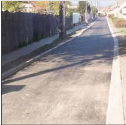
Aszfaltszőnyeg a Knezich utcában

Már számos nagykőrösi utcában befejezték az aszfaltozási munkákat, mint például a Knézich és az Esze Tamás utcákban. A földmunkák eközben újabb és újabb utcákban zajlanak, többek között a Lahner és a Csipvári utcákban dolgoznak a munkások, hogy hamarosan ott is aszfaltszőnyegen közlekedhessenek az ott élők. Az építkezésnek köszönhetően közel félszáz utca kap aszfaltburkolatot Nagykőrösön.