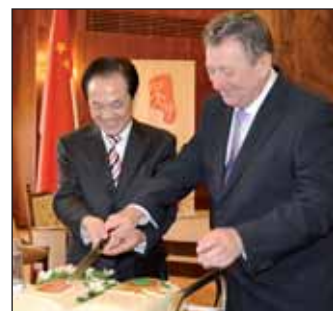
A látogatók tiszteletére 50 szeletes, Nagyőrös és Wuzhong kerület címereivel ellátott ünnepi tortát készítették