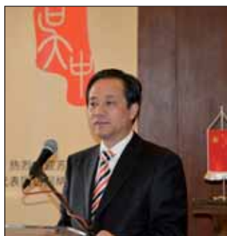
A kínai delegáció vezetője, Yu Xingnan köszöntötte a nagyőrösieket