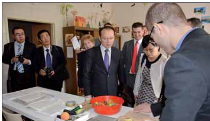
A Nagyőrösi Rehabilitációs Szakkórház és Rendelőintézet látogatása