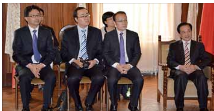
A kínai delegáció tagjai