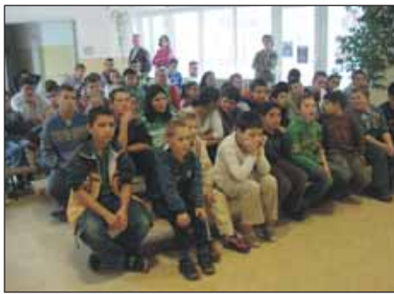
Érdeklődve figyeltük az előadást!

soknak. Nehezebb feladat várt a 3-5. osztályosokra. Ők feladatokon keresztül tapasztalhatták meg, hogyan változtatja meg a magánhangzók és mássalhangzók hosszúsága a szó jelentését. A legnagyobbaknak a hangalak és jelentés közötti kapcsolat ismeretéről kellett számot adniuk. A nyelvtörők gyors, pontos elmondása jelentette azonban számunkra az igazi kihívást!