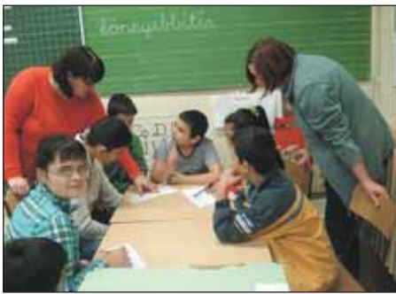
Munkában a 3-4. osztályosok

November 13-át a magyar nyelv napjává nyilvánította az országgyűlés, mert 1844-ben ezen a napon vált ismét államnyelvvé a magyar.