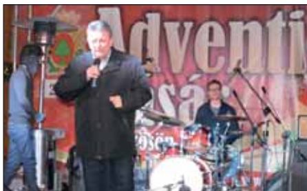
Dr. Czira Szabolcs polgármester nyitotta meg az Adventi Vásárt