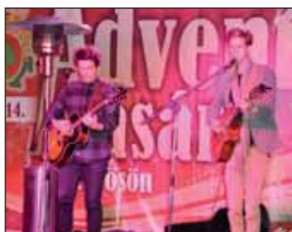
AB Duó zenekar műsora