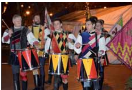
Zászlóforgatók látványos bevonulása