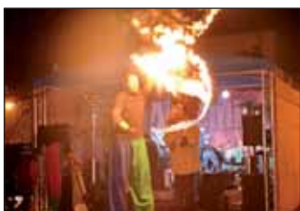
Gólyalásbas tűzsonglörök bemutatója