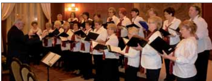
Városi Kórus adventi hangversenye