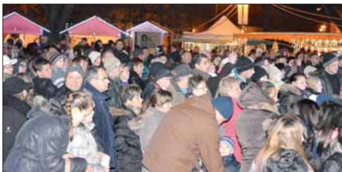
Népszerűek az Adventi Vásár koncertjei