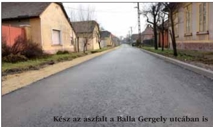
Kész az aszfalt a Balla Gergely utcában is

Egyre több utca kap aszfaltburkolatot a nagyszabású útépítési program során, mely sok nagykőrösi ember életét könnyíti meg a téli hónapokban is. Az útépítés jövőre is folytatódik a harmadik és a negyedik ütemben érintett utcák aszfalttal történő ellátásával. Közben szilárd burkolatot