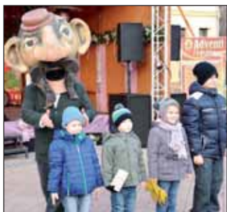
Interaktív mesejáték óriásbábokkal, és egész napos Luca-napi játszótér várta a gyermekeket szombaton