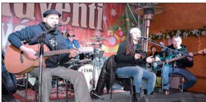
Fergeteges Zanzibár koncert