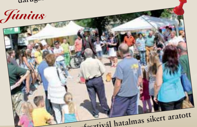
Az I. Kőrösi Mögyfeszti hatalmas sikert aratott

A 2014-es évet bemutató képes visszatekintő folytatását az Önkormányzati Hírek következő lapszámában tekinthetik meg!