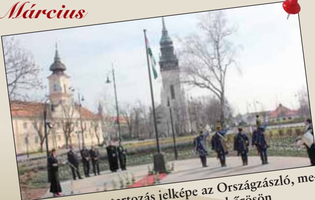
A nemzeti összetartozás jelképe az Országzászló, melyet március 15-én avattak fel Nagykőrösön