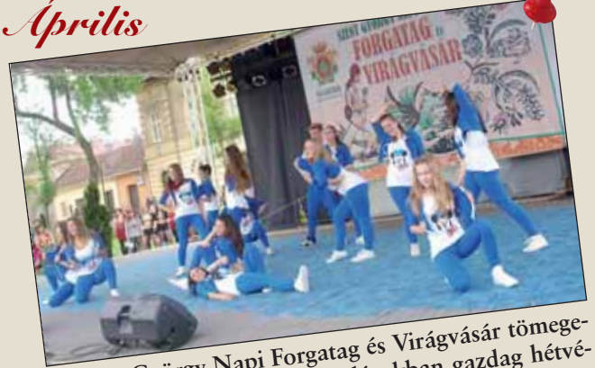
A Szent György Napi Forgatag és Virágvasár tömeget vonzott – nagyszerű előadásokban gazdag hétvége volt