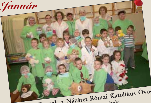
Gyógyító Bocskok a Názáret Római Katolikus Óvodában – jókedvű nagykőrösi gyermekek