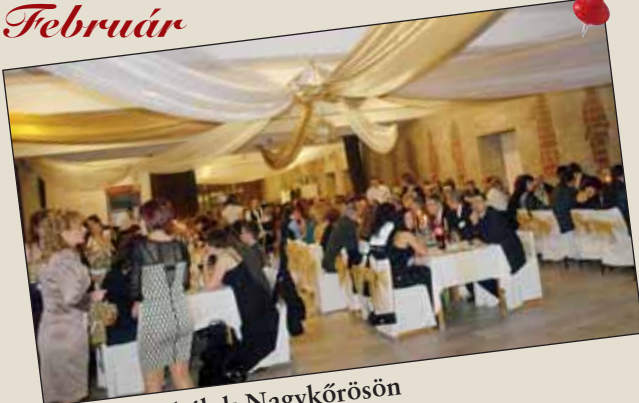
Csodaszép bál Nagykőrösön