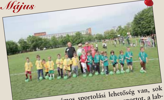
Nagykőrösön számos sportolási lehetőség van, sok fiatal választja az egyik kedvenc tömegsportot, a labdarúgást