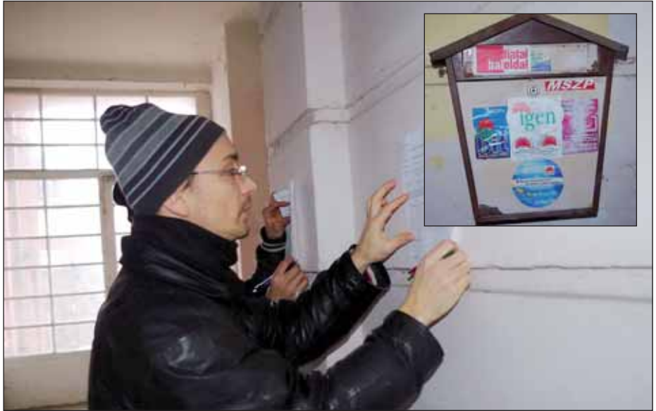
Munkában a KÖVA ZRT. munkatársai