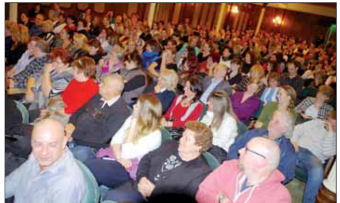
Az előadásra teltház közönség volt kíváncsi