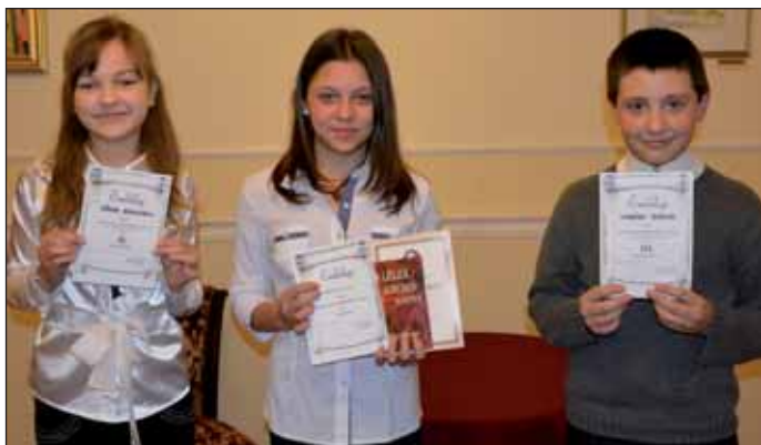
Az 5–6. évfolyam díjazottjai

A Kazinczyról elnevezett Szép Magyar Beszéd verseny II. fordulójára a ceglédi és nagykőrösi tankerület, valamint a területi egyházi iskolák tanulói számára 2015. január 19-én került sor. Ez a rendezvény hagyományosan a magyar kultúra napja megünneplésével kapcsolódik össze. A versenyt az előírásoknak megfelelően az 5–6. évfolyamos diákok számára rendezték meg a Nagykőrösi Arany János Kulturális Központban, a Nagykőrösi II. Rá-