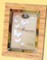
Fényképtartók 1500 Ft-tól