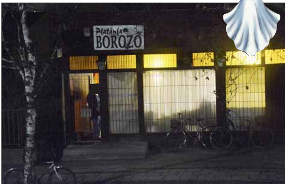
Élénk élet folyik a „szellemkocsmában”

Romkocsmának nem nevezhető, azért annál jóval jobb állapotban van. Nevezzük inkább helyette szellemkocsmának a létesítményt, melynek nincsen érvényes működési engedélye, és jelentős tartozást halmoztak fel a KÖVA-KOM felé a tulajdonosok. Van már hónapok óta önkormányzati képviselő-testületi bontási határozat is a felépítményre, de az továbbra is „tartja magát”. A telek önkormányzati, az épület magántulajdon. Sőt mi több, élénk élet folyik a „szellemkocsmában”, igaz, immár klubjelleggel. Déléltönként szellemek cipekednek, csörögnek sörösrekeszekkel, egyebekkel. Ők nem láncikat csörgetik, sokan közülük nagyon sportosak, drótszamarakkal érkeznek a helyszínre. Kerékpárjaikat a szellemkocsmá falához támasztják.