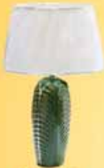
Lámpák 6600 Ft-tól