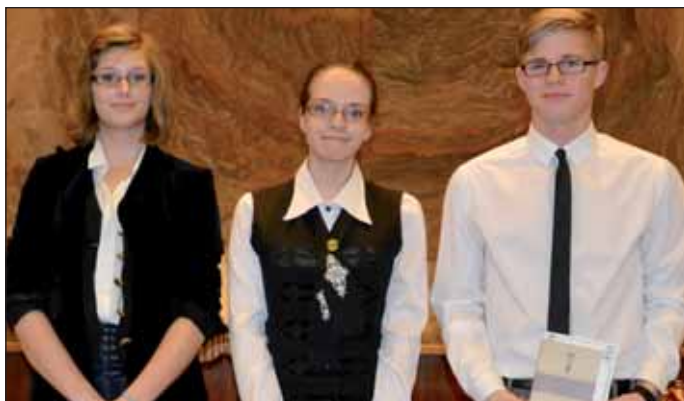
A 7–8. évfolyam díjazottjai

A szabadon választott és kötelező szövegek bemutatása