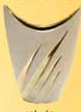
Vázák 3700 Ft-tól