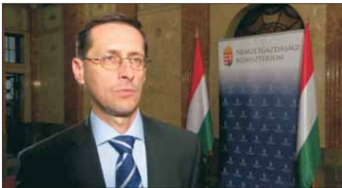
A fotón Varga Mihály nemzetgazdasági miniszter

– a svájci jegybank lépése megerősítette a kormány devizaadósságokat csökkentő törekvéseit