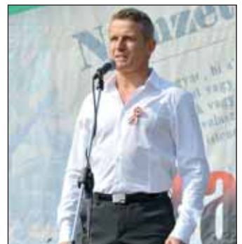
Rékasi Károly színművész előadása