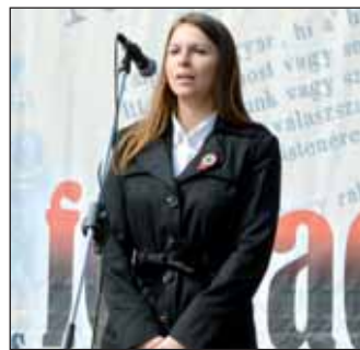
Szabó Anett népdalénekes közreműködésével hangzott el a Himnusz és a Szózat