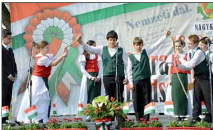
A Nagykőrösi II. Rákóczi Ferenc Általános Iskola irodalmi színpadának ünnepi műsora