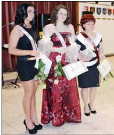
A Polgári Bál szépei

Tekintsék meg képgalériánkat az Önkormányzati Hírek Nagy-kőrös Facebook oldalán!