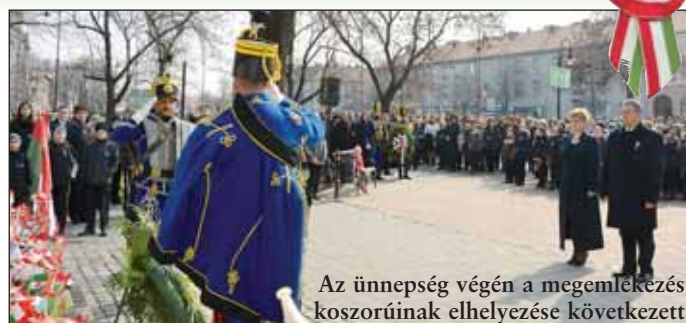
Az ünnepség végén a megemlékezés koszorúinak elhelyezése következett