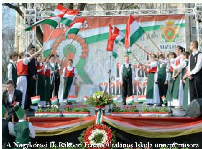
A Nagykőrösi II. Rákóczi Ferenc Általános Iskola ünnepi műsora