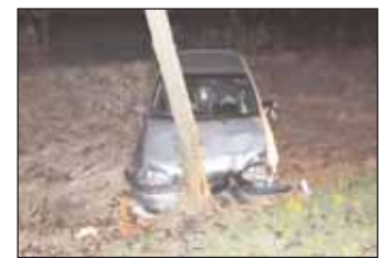
Lapunkat a Nagykőrösi Rendőrkapitányság tájékoztatta.

2015. március 22-én 19 óra 45 perckor egy 40 éves nagykőrösi férfi az általa vezetett személygépkocsival közlekedett Nagykőrös külterületén Kocsér felől Nagykőrös irányába. Haladása során a kátyús, gödrös úttesten elvesztette uralmát a gépjármű fölött, a jobb oldali füves padkán megcsúszott, majd az útszéli fának ütközött. A baleset során személyi sérülés nem történt, anyagi kár keletkezett. Az elsődleges adatok alapján a vezető feltehetően ittasan ült volán mögé, ellene rendőrségi eljárás indult.