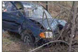
Lapunkat a Nagykőrösi Rendőrkapitányság tájékoztatta.

amikor a megyehatárnál balra kívánt fordulni. Kanyarodása előtt nem győződött meg a forgalmi helyzetről, emiatt nem észlelte, hogy a mögötte, vele azonos irányba haladó személygépjármű a teherautó előzésébe kezdett. A személyautó 51 éves vezetője a vészfékezés és a kormány balra rántása ellenére sem tudta elkerülni az ütközést. A személygépkocsi a menetirány szerinti bal oldali útarokba csapódott. A balesetben a személygépkocsi utasa – egy 28 éves hölgy – nyolc napon belül gyógyuló könnyű sérülést szenvedett, a gépjárművekben anyagi kár keletkezett.