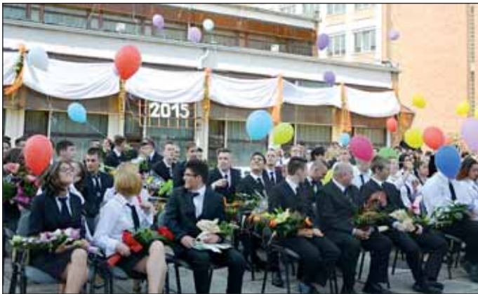
A Toldi iskola tanulójának ballagása