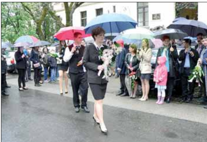
Az Arany Gimnázium ballagási ünnepsége

Képgalériákat az Önkormányzati Hírek Facebook oldalán talál!