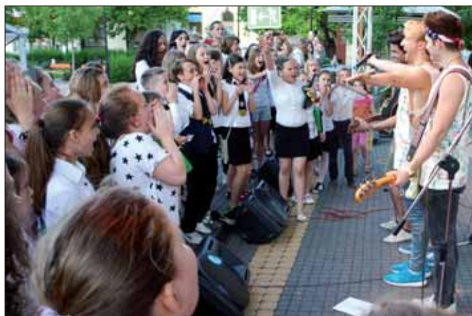
A Spoon együttes fergeteges koncertje

Keresse képgalériánkat az Önkormányzati Hírek Nagykőrös Facebook oldalán!