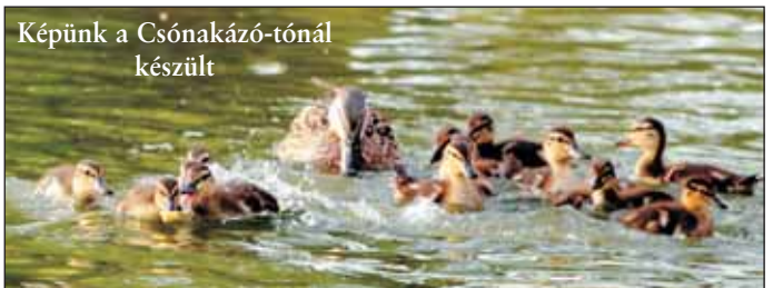
Képünk a Csónakázó-tónál készült

Az ORFK közleménye szerint szigorúan fel fognak lépni azokkal szemben rendőreink, akik illegális helyen fürdenek. Így azok ellen is, akik „bemerészkednek” a Csónakázó-tóba. A tiltott helyen való fürdőzés szabálysértésnek minősül, amelyért 5 ezertől 50 ezer forintig terjedő bírságot szabhatnak ki a hatóságok – mondta az M1 csatorna vasárnap déli híradójában az Országos Rendőr-főkapitányság (ORFK) szóvivője. LV