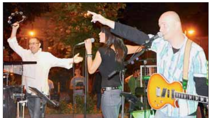
A szombat este a Gríz Zenekarral együtt késő estebe nyúló Utcabállal zárult