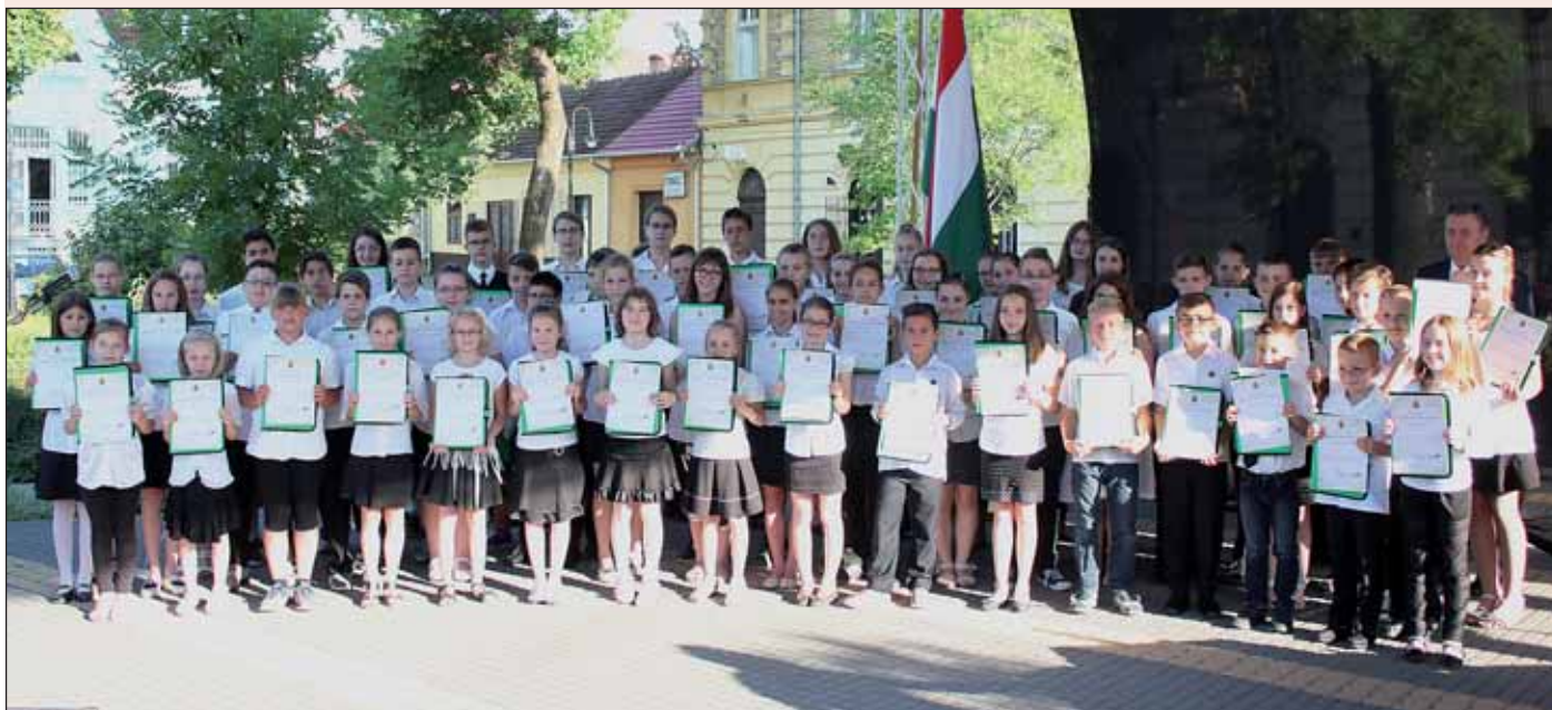
A Nagykőrösi II. Rákóczi Ferenc Általános Iskola kiváló diákjai

Lapunk az idei évben is iskolánként közli a kiváló diákok névsorát.