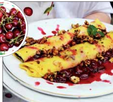
Nehéz dolga volt a zsűrinek a főzőversenyen

A Kőrösi Möggyfesztivál már második alkalommal került megrendezésre június végén, melynek fontos célja volt az egyedi, sajátos magyar alkotás, termék bemutatása, hogy felhívják a figyelmet a kőrösi, illetve a nemzeti értékeinkre, hogy a méltatlanul elfeledett gyümölcsöt, a meggyet helyezze a középpontba és jelenítse meg azt az elkészített ételeken, italokon és a hagyományok felelevenítésén keresztül. Célul tűzték ki továbbá a rendezvény egyedi jellegének megalapozását, a szellemi kötődést és Nagykőrös fejlesztését, a helyi tradíciók, hagyományok ápolását, azok megismertetését, átadását a színpadi produkciók, a művészeti csoportok bemutatói, gasztronómiai programok és egyéb kiegészítő programok által, hogy a helyi és a más településekről idelátogató közönség számára minőségi szórakoztatást nyújtsanak a közösségépítő programok által.