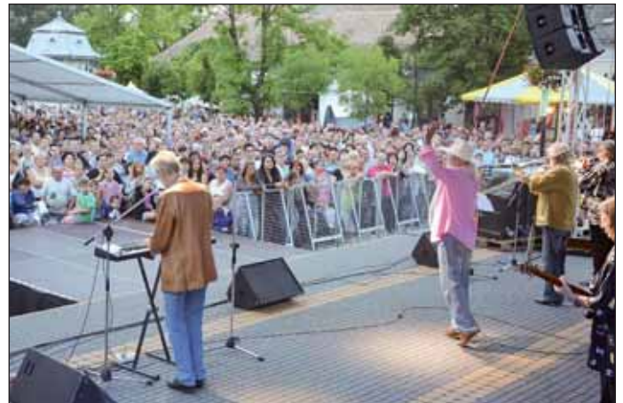
Az Apostol együttes „Nehéz a boldogságtól búcsút venni...” című élő koncertje