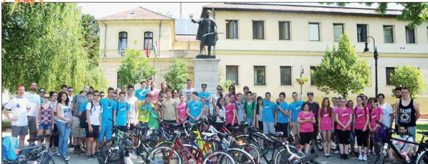
A kecskeméti Piarista Gimnáziumból több csoport biciklizett át Nagykőrösrre, akik nagyon jól érezték magukat városunkban

Sétánk során örömmel láttuk, hogy mekkora élet van a központban. Fagyizó gyermekek, biciklis diákok kérésünkre örömmel mosolyogtak a kamerába. A kecskeméti Piarista Gimnáziumból több csoport biciklizett át Nagykőrösrre, hogy egy kis időt városunkban töltsenek, a Kossuth iskolások a téren nagy boldogan fagyiztak, az Arany iskolás diákok még éppen sorban álltak a finom hűsítő fagyaltért.