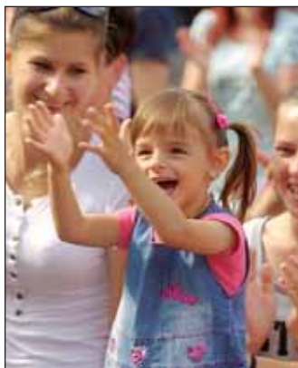
Népszerűek voltak a gyermekműsorok is