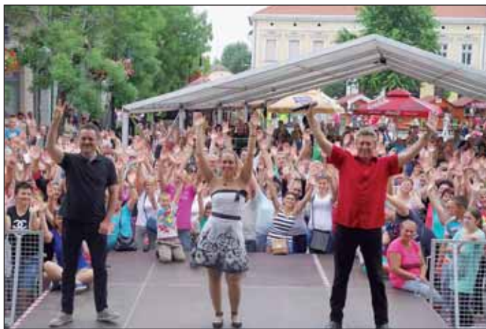
„Jó ebédhez szól a nóta”, a Dupla Kávé Zenekar fergeteges koncertje