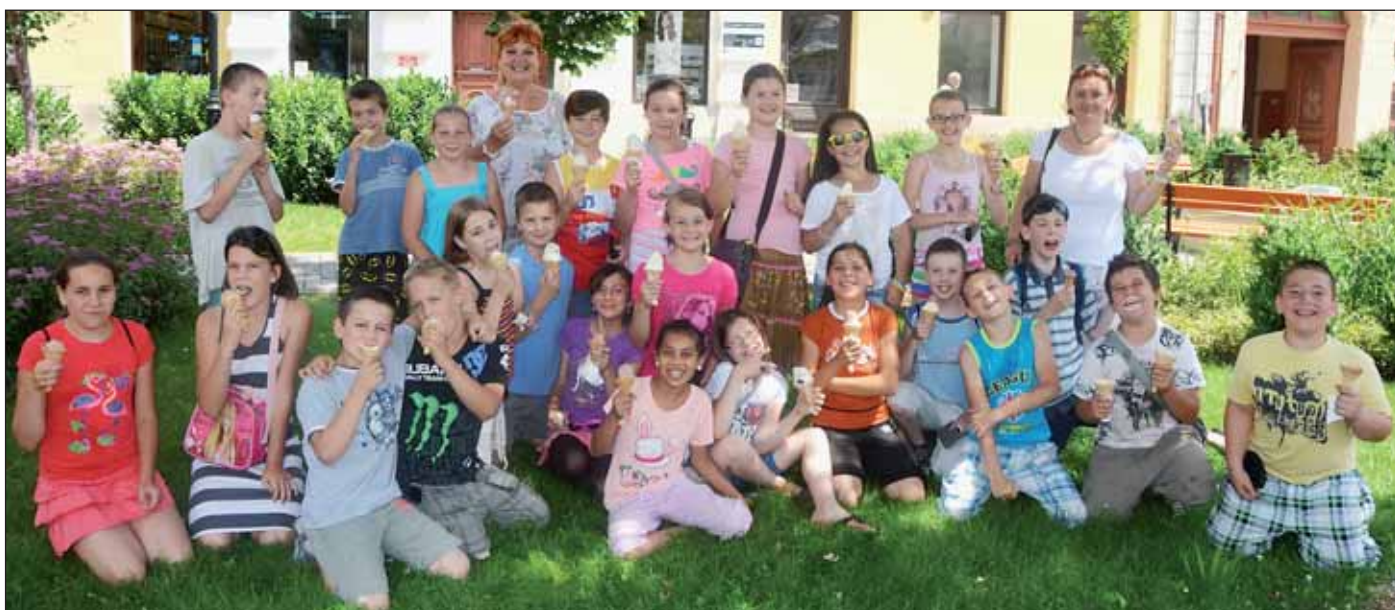
A Kossuth iskolások a város központjában nagy boldogan fagyiztak