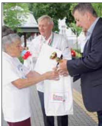
A Főzőverseny és Receptverseny ünnepélyes eredményhirdetése