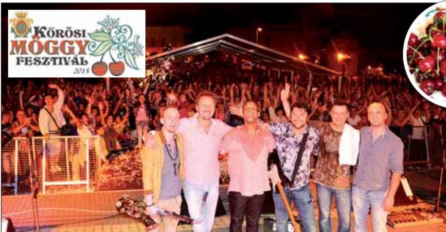
Tombolt a közönség a Back II Black koncerten