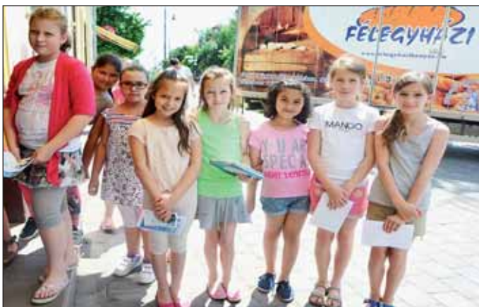
Az Arany iskolás diákok éppen sorban álltak a finom hűsítő fagyaltért

Sétánk során örömmel láttuk, hogy mekkora élet van a központban. Fagyizó gyermekek, biciklis diákok kérésünkre örömmel mosolyogtak a kamerába. A kecskeméti Piarista Gimnáziumból több csoport biciklizett át Nagykőrösrre, hogy egy kis időt városunkban töltsenek, a Kossuth iskolások a téren nagy boldogan fagyiztak, az Arany iskolás diákok még éppen sorban álltak a finom hűsítő fagyaltért.