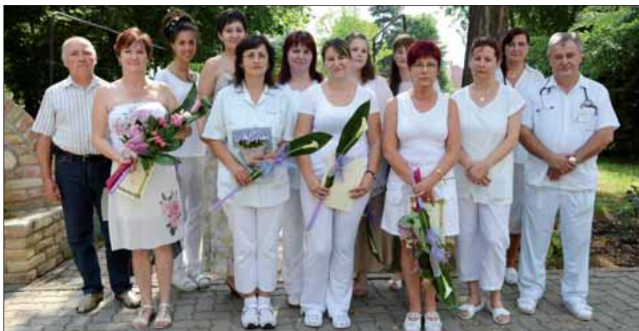
Elismerő kitüntetésekben részesültek a dolgozók