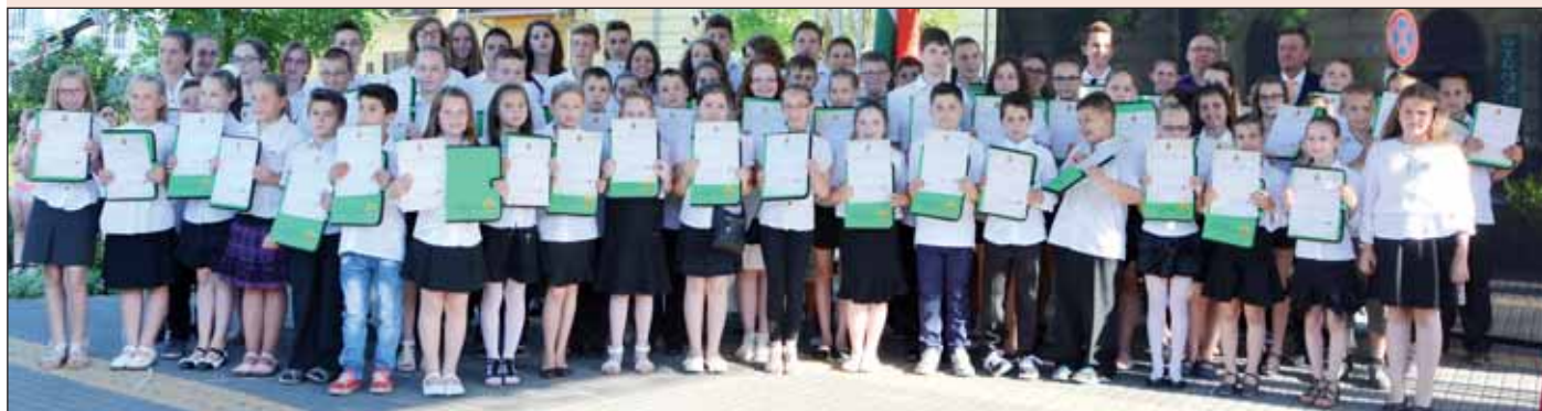
A Nagykörösi Kossuth Lajos Általános Iskola kiváló diákjai

Lapunk az idei évben is iskolánként közli a kiváló diákok névsorát.