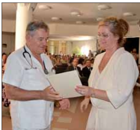
Vastappsal is megköszönték az orvosok munkáját