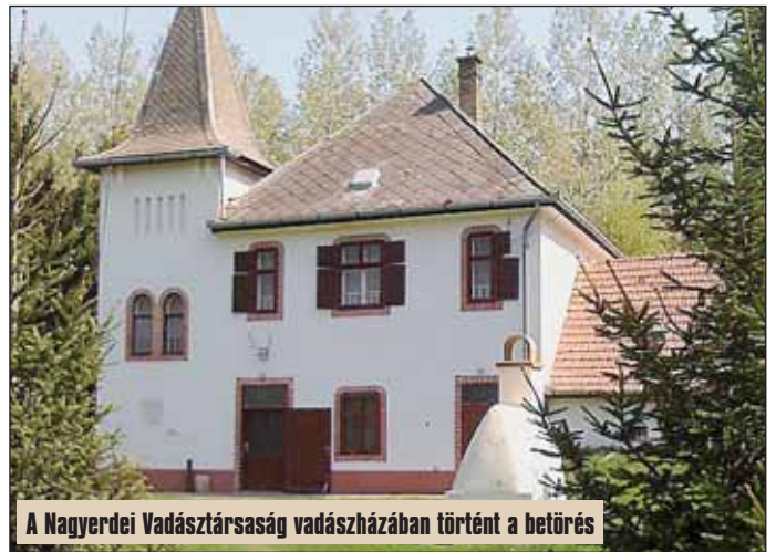
A Nagyerdei Vadásztársaság vadász házában történt a betörés

Lapinformációink szerint a Nagyerdei Vadásztársaság vadász házában Nagykorösön mintegy két héttel ezelőtt betörés történt, a kutyákat elaltatták, akik két nap múlva ébredtek fel. A vadász házból nagy értékű trófeákat tulajdonítottak el ismeretlen tettesek. Ezzel kapcsolatban kérdeztem meg a rendőrség illetékeseit, a Pest megyei szóvivők nem tudnak ugyan a kutyák elaltatásáról, de a betörés tényét lapunknak megerősítették.