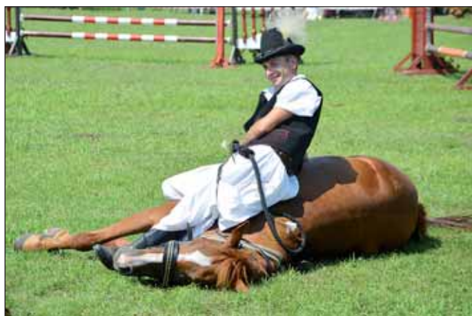
Népszerű volt a csikósbemutató is