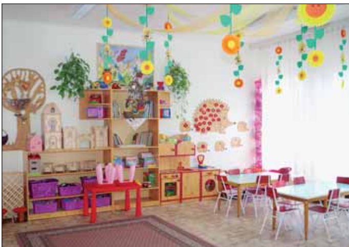
Szép, vidám, feldíszített csoportszobák várják a Nagykőrösi Városi Óvoda Kárász utcai épületében is a gyerekeket