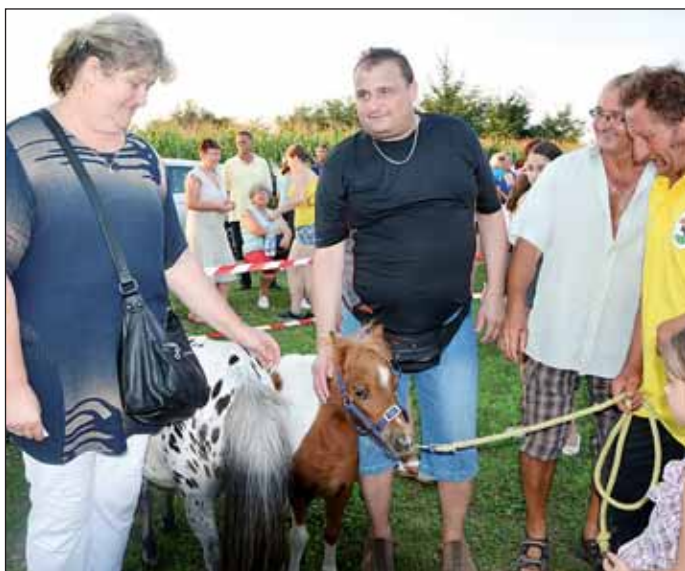
Végül a nap fődíja, Leopold, a kis pónicsikó is otthonra lett