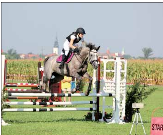
Látványosak voltak a díjugrató versenyszámok