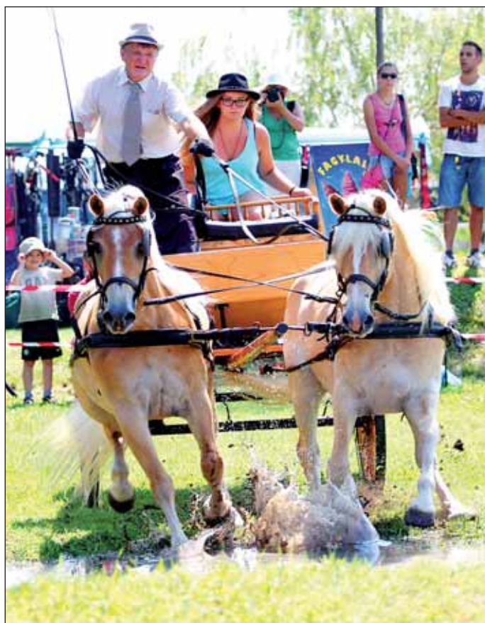
A fogathajtó bemutatók is nagy sikert arattak a közönség körében