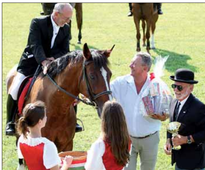
A díjátadás pillanatai