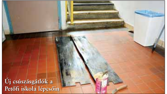
Új csúszásgátlók a Petőfi iskola lépcsőin