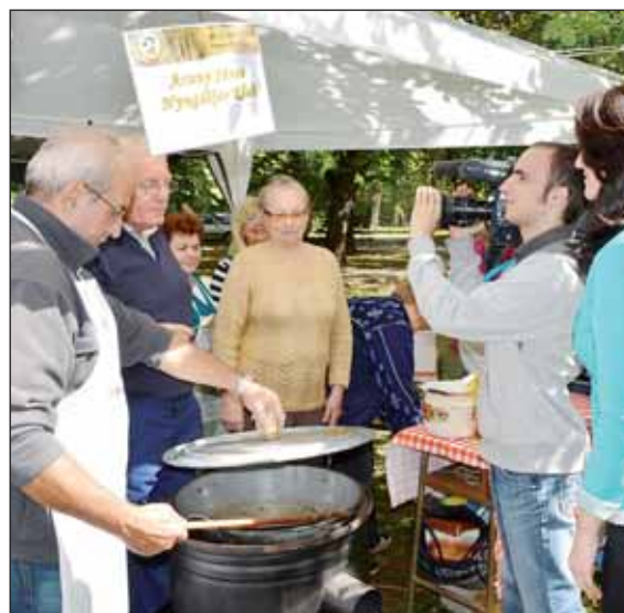
A főzőverseny pillanatai