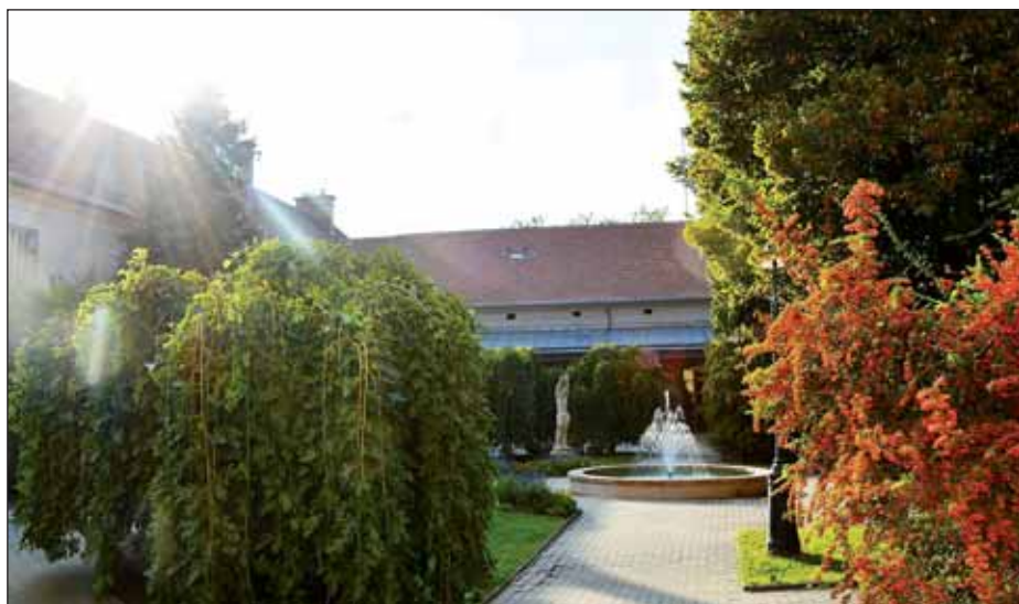
Képünk a Nagykőrösi Polgármesteri Hivatal udvarán készült

További részletek lapunk 9. oldalán és következő lapszámunkban!