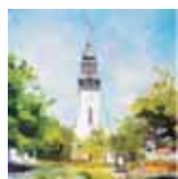
Képünk illusztráció: Király László festménye

címmel 5–14 év közötti gyermekek számára.