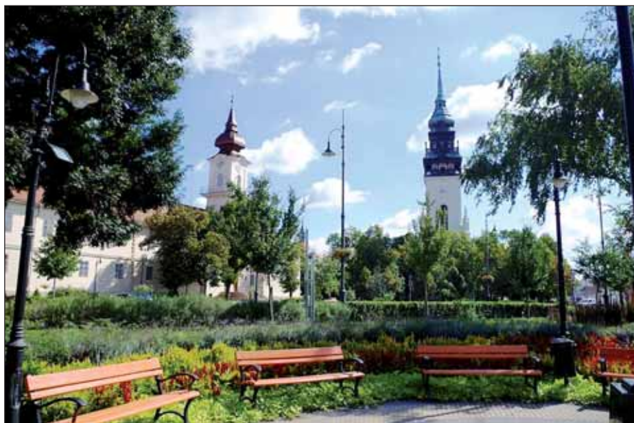
Képünk Nagykőrös város főterén készült