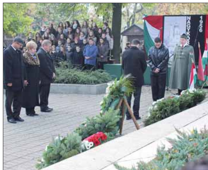
A kegyelet és megemlékezés virágainak elhelyezése

Hogy a megemlékezés napjai békésen teljenek, fogadja meg a Pest Megyei Rendőr-főkapitányság tanácsait, hogy ne váljon bűncselekmény áldozatává!