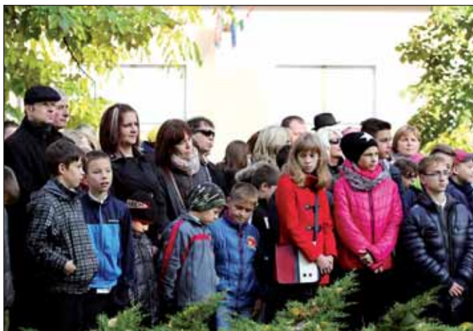
Sokan vettek részt a városi megemlékezésen