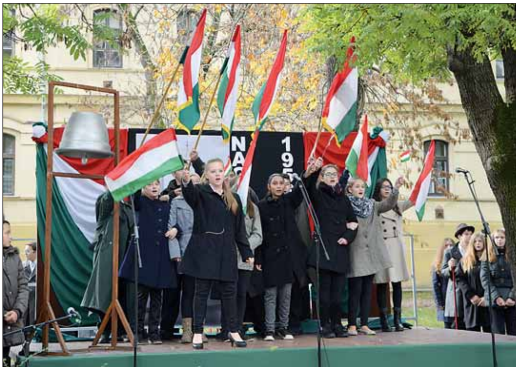
Az Arany János Református Általános Iskola és Óvoda irodalmi színpadának méltó emlékműsora