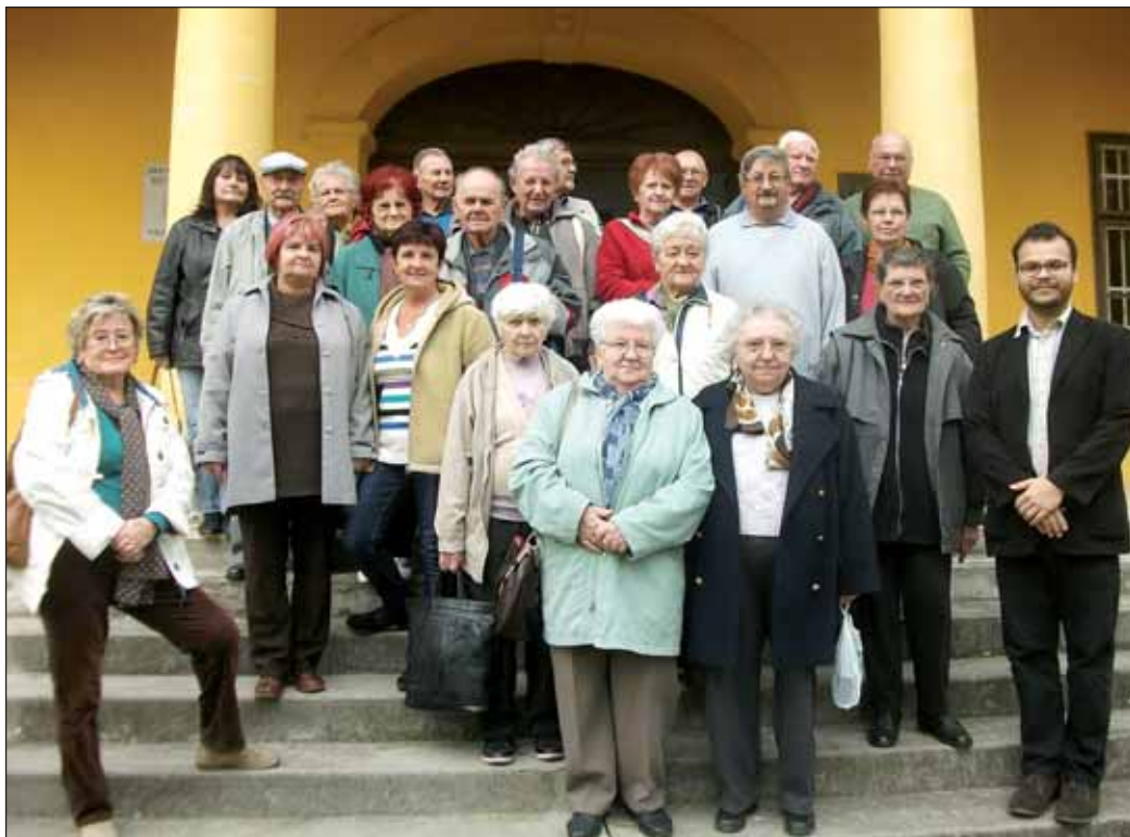
Az esztergomi csoport látogatása Nagykőrösön