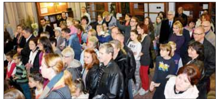
Sokan jöttek el a kiállítás megnyitójára is