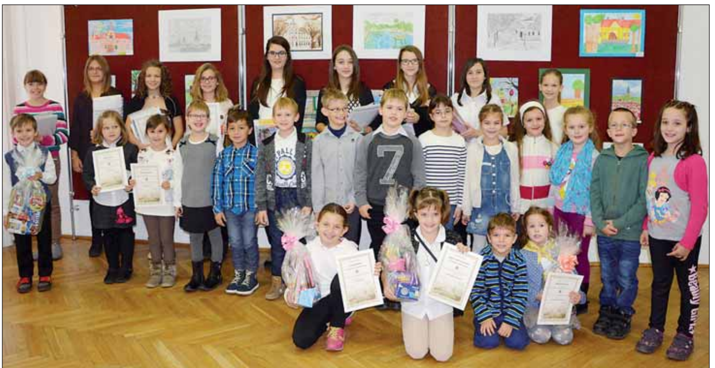
A „Szeretem Nagyköröst 2015” rajzpályázat díjazottjai