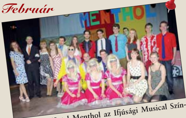
Frenetikus Hotel Menthol az Ifjúsági Musical Színpad előadásában