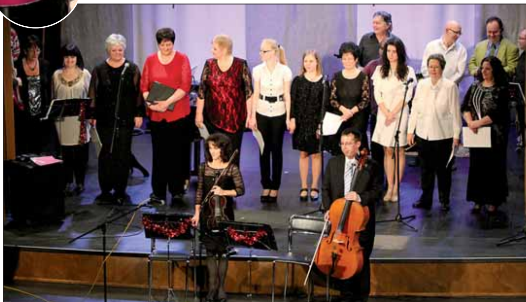
A Weiner Leó Zeneiskola tanárai és növendékei ismét varázslatos pillanatokot okozva tették még meg-hittebbé a karácsonyi ünnepeket