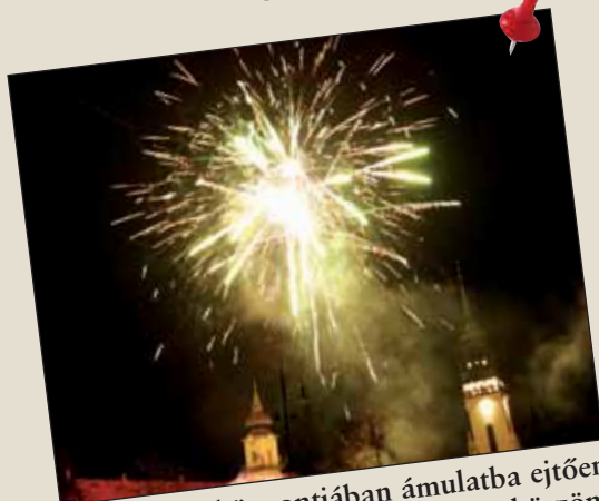
Nagykőrös központjában ámulatba ejtően szép tűzijáték várta az újesztendőt köszöntőket