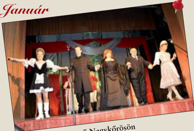
Fényes Újévköszöntő Nagykőrösön