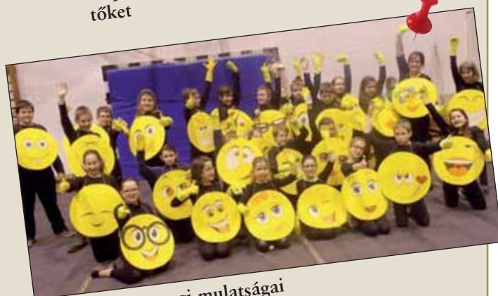
Aranyosok farsangi mulatságai