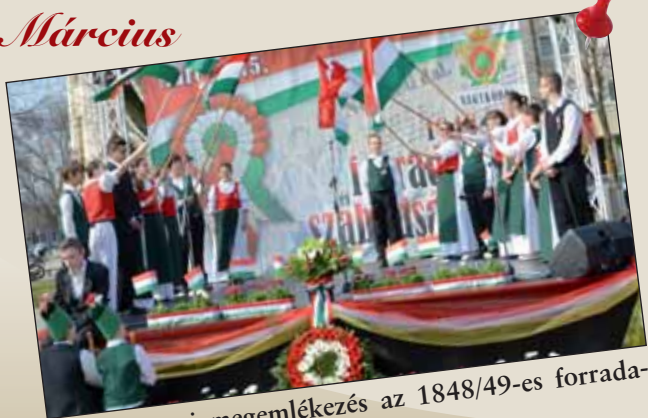
Méltó városi megemlékezés az 1848/49-es forradalom és szabadságharc tiszteletére