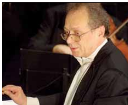
Vezényelt Pfeiffer Gyula, a Magyar Állami Operaház karmestere

Tekintsék meg képgalériánkat az Önkormányzati Hírek Nagykőrös facebook oldalán!