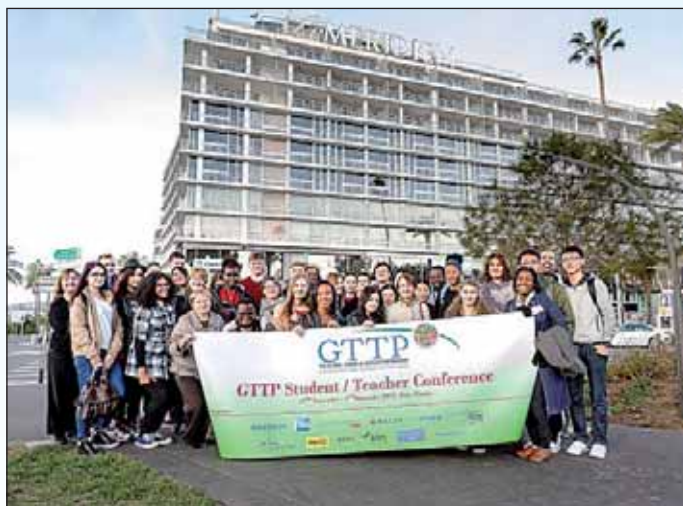
A nemzetközi csoport a szálloda előtt