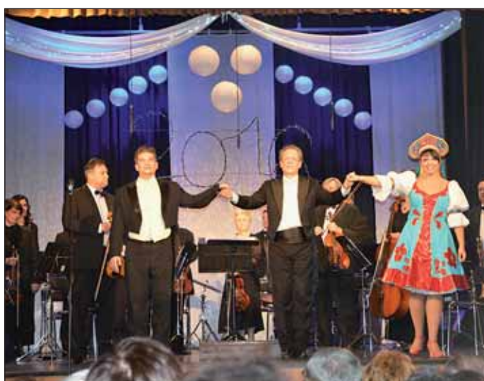
Többszörös vastaps fogadta az ünnepi műsort