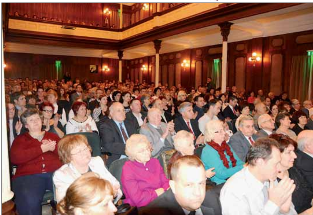
Teltházás tömeg az Újévi koncerten