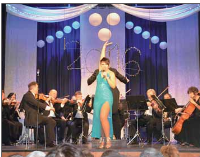
A Váci Szimfonikus Zenekar parádés koncertje