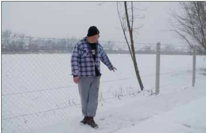
Járda, betemetett Sóki gödör és új kerítés – nagyot fejlődött a Maros utca