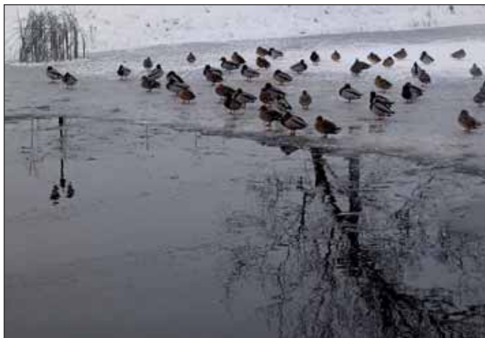
A Csónakázó-tó télen is varázslatos

A gyermekek nagy örömeire végre leesett az első hó, így Nagykörös városa téli pompában mutatja meg értékeit. A városban sétálva szebbnél szebb, varázslatos pillanatok lehet megörökíteni, így a fotózni szeretők figyelmét is felhívjuk a 2016-os fotópályázatunkra, melyről bővebb részleteket a www.nagykoros.hu oldalon találhatnak. További téli képeket tekinthetnek meg Nagykörös kincseiről az Önkormányzati Hírek Nagykörös facebook oldalán! Fedezzék fel Önök is a tél szépségeit!