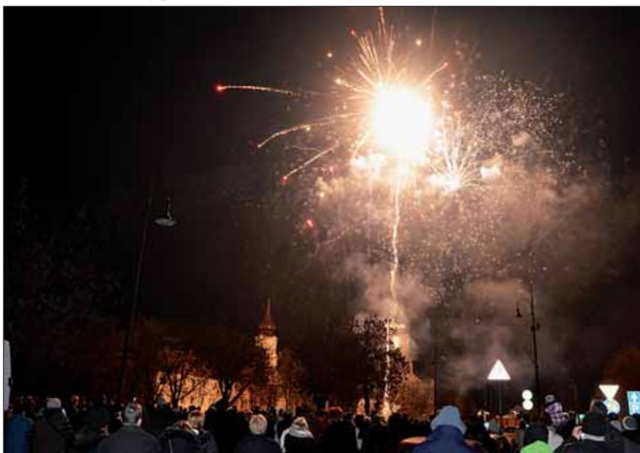
Látványos tűzijáték Nagykőrös város főterén