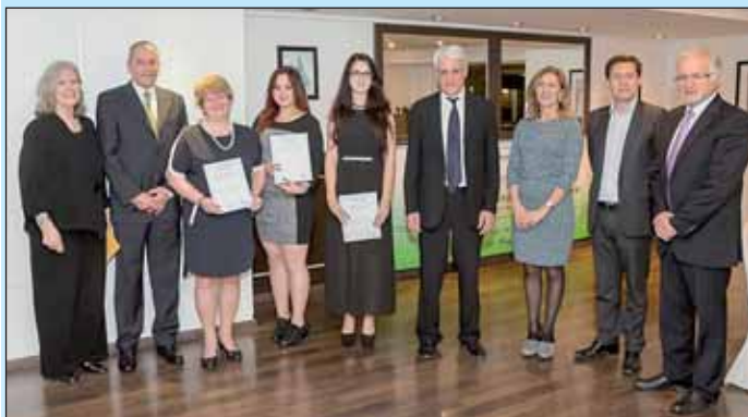
Támogatóink és segítőkink

Megjöttünk a „nagy utazásból”, Nizzából sok-sok élménnyel és tapasztalattal. A nemzetközi GTTP Diák-Tanár Konferencia számunkra fantasztikus volt.