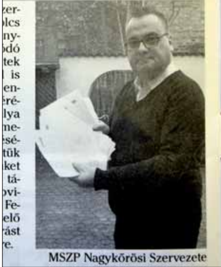
MSZP Nagykovácsi Szervezete

Gyűjtik az aláírásokat, s úgy tűnik, erre Nagykovácsin a „csatornatéma” manapság a legalkalmasabb, hiszen ebben a témában indított aláírásgyűjtést az MSZP és a civilségét hangsúlyozó, az önkormányzati választásokon még konzervgyár indítását ígérő Jobb Nagykovácsért Egyesület is. No és miért is gyűjtik az aláírást, persze, hogy azért, mert a „pénz visszajár!” És mitől jár vissza? Ha aláírják az éppen