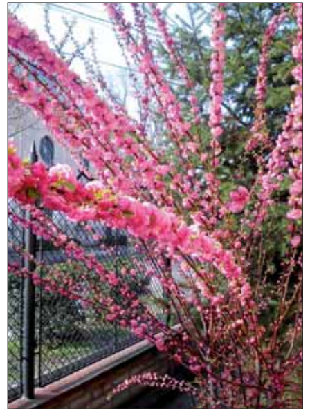
Kinyílt a babarózsa a Patay utcában