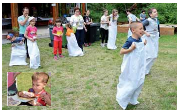
Családi sor és váltóverseny