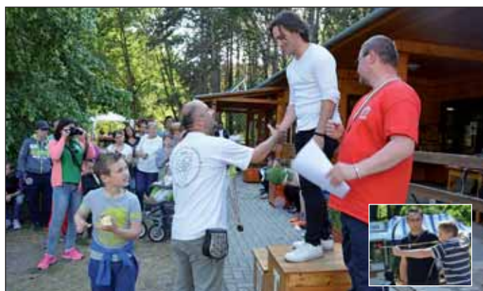
Ünnepélyes eredményhirdetés és díjátadó