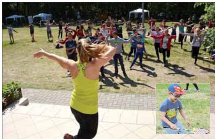
Közös bemelegítés Détári Ancsival