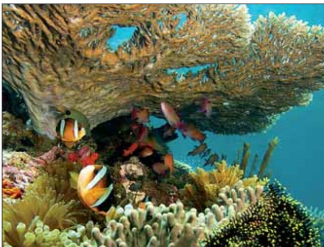
Ras Mohhamed korallzátony, Egyiptom

Ebben a hónapban is, immár kilencedik alkalommal volt szerencsém a látogatóközönséget fogadni egy újabb előadás keretében, mely „ Afrikai természeti értékei – A Kilimandzsáró tetejétől a Szahara szívéig ” címet kapta. A témakör hatalmas volt, így az eredeti célotmat szem előtt tartva – hogy a közönséggel megismertessek a világ minden országának legalább egy fontos földrajzi értékét – az afrikai kontinens Egyenlítőnél északra fekvő országait mutattam be ezen estén. A déli területek egy