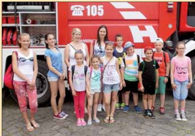
A Nagykőrösi Önkormányzati Tűzoltóság május 29-én Nyitott szertárkapuk elnevezéssel hirdett programot, melyen