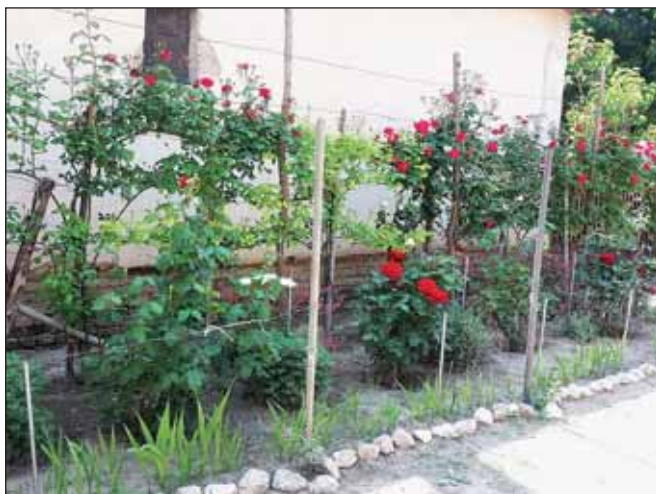
A képet Orhegyi Lászlóné Fény utca 4. szám alatti lakos küldte be kertje részletéről. Fogadják sok szeretettel!