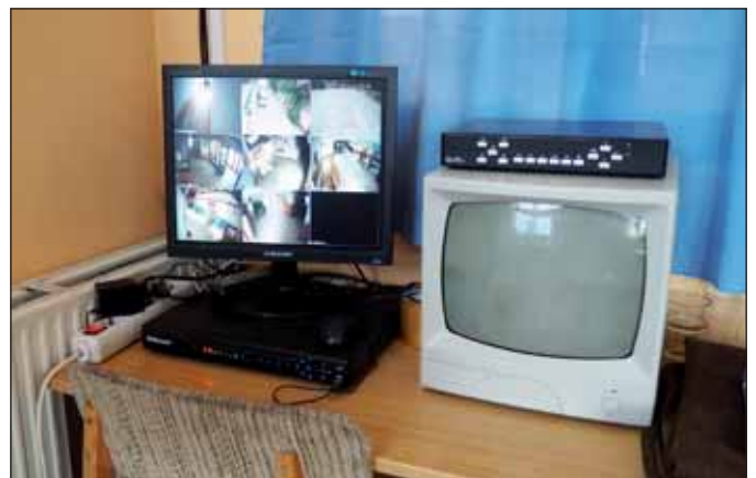
Folytatták a kamerarendszer kiépítését a Kossuth Iskolában

ülni, tanulásra és beszélgetésre is kiválóan megfelel.