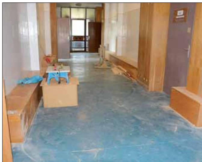
A Petőfi iskola folyosóján folytatódott az ülőfelületek kialakítása

Jövő héten a Rákóczi iskolában megvalósult beruházásokat is megmutatjuk Önöknek!