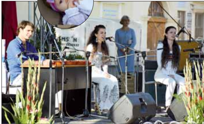
A Török Trió Zenekar műsora