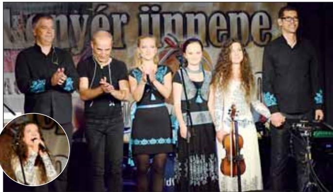
A Holdviola és a Török Trió Zenekar ünnepi műsora