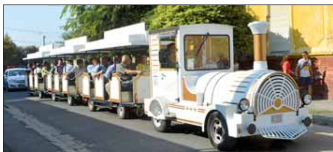
A városnéző kisonnat igen kedvelt volt