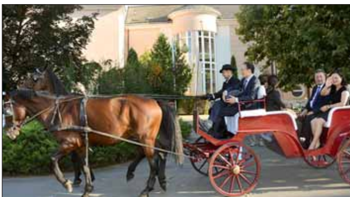
Lovas kocsis is várta a delegáció tagjait