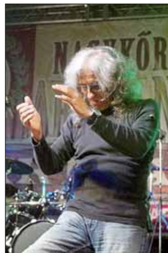
Karthago élő koncert