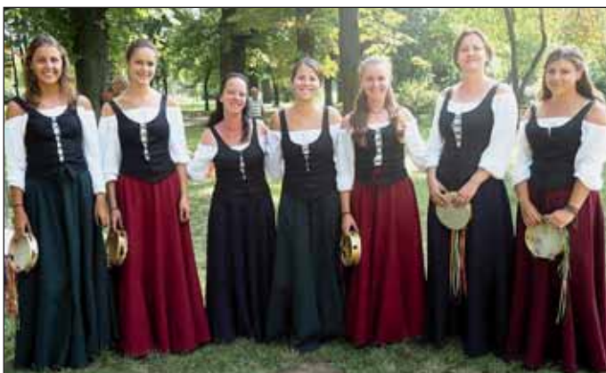
Visegrádi Primavera Táncegyüttes