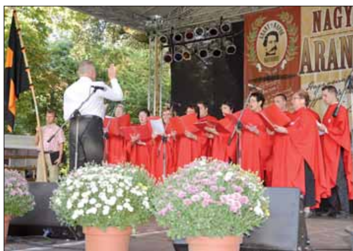
A Szászrégeni Gyöngyvirág Néptáncsoport is bemutatkozott és a katolikus CUM IUBILO kórus műsorát is megcsodálhattuk