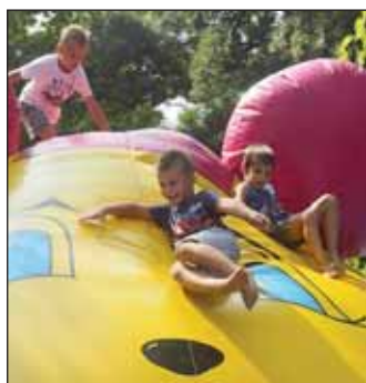
A gyerekprogramok is népszerűek voltak