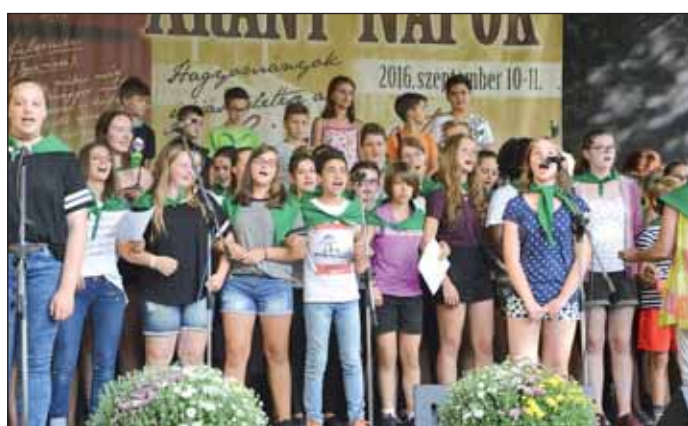
A nagykörsi Arany János Református Gimnázium és az espelkampji Birger-Forell Evangélikus Iskola Centrum kórusainak közös műsora