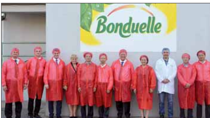
Látogatás a Bonduelle helyi gyáregységében