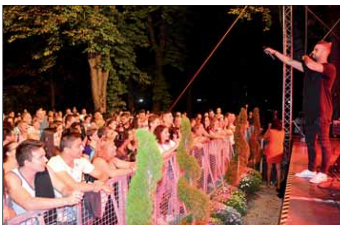
Kállay Saunders Band élő koncertje