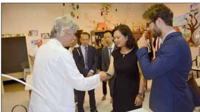
Bemutatták a kórházban folyó magas szakmai szintű munkát