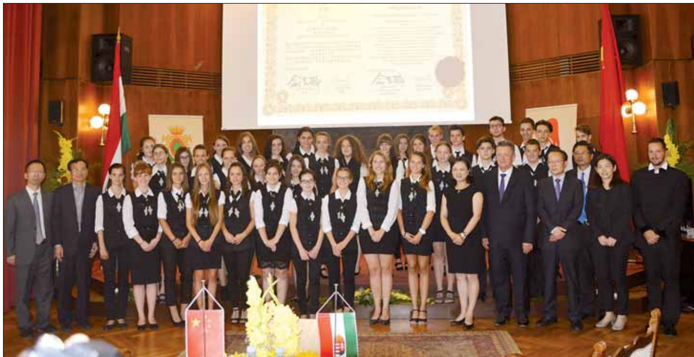
A delegáció tagjait az Arany János Református Gimnázium már országos hírű kórusa köszöntötte

mester úrnak ezt az egész napos csodálatos programot.”