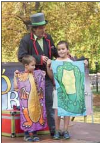
A bűvész ismét varázsolt