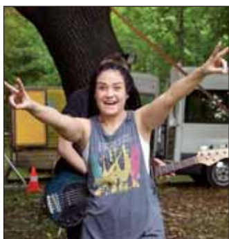
A Zanzibár hatalmas bulit csapott