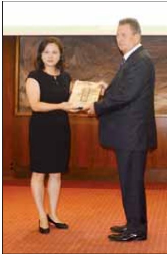
Ms. Jin Iie elnök értékes ajándékkal lepte meg városunkat