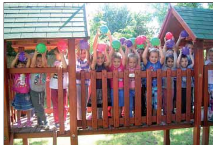
A Süni csoportos gyermekek és az óvó nénik

Október 1-jén, az Idősek Világnapja alkalmából a már hagyományoknak megfelelően ismét megrendezték az Idősek Vacsoráját a Nagykőrösi Kosuth Lajos Általános Iskola tornacsarnokában, a Nagykőrösi Arany János Kulturális