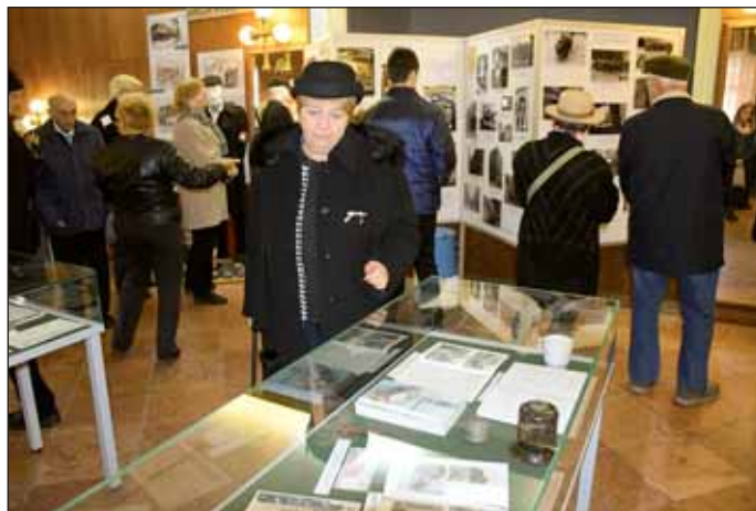
„Mert egy nép azt mondta: Elég volt” című kiállítás megnyitója