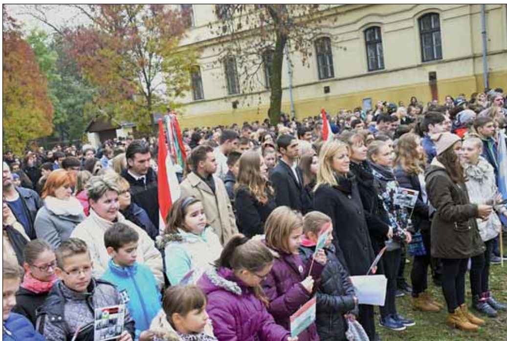
A városi megemlékezésre eljött a város apraja-nagyja