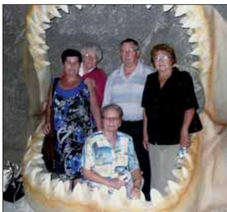
Cápaszájában az Arany János Klub

Sopron környékét igyekeztük felfedezni 2016. szeptember 11-12-13-án. Rajtunk kívül még 300 személy vett részt a programban. A dal-tánc-vers vetélkedőn már csak 34-en vettünk részt, amelyért szép emléklapot kaptunk.