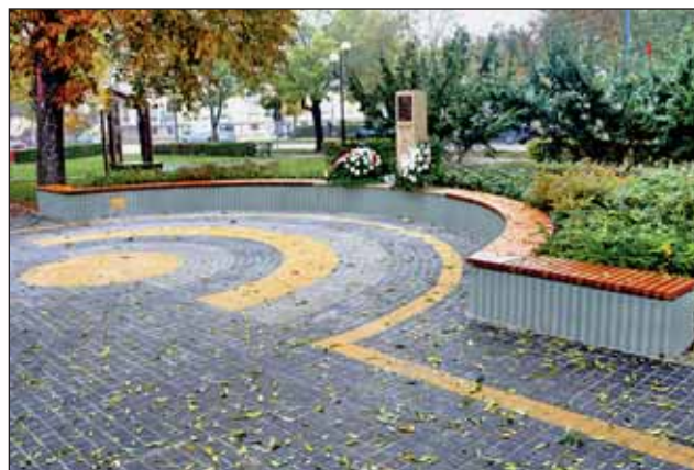
A „Nagykőrösi Büszkeségpont” méltó helye lett az emlékezésnek

„Ahol a hősokeket nem felejtik, ott mindig születnek újak” – átadták a „Nagykőrösi Büszkeségpontot” 2016. október 23-án, így sikerült városunkban méltó módon megünnepelni az 1956-os forradalom és szabadságharc 60. évfordulóját. A projektet az 1956-os forradalom és szabadságharc 60. évfordulójára létrehozott Emlékbizottság támogatta. A támogatás mértéke 2 millió forint volt.