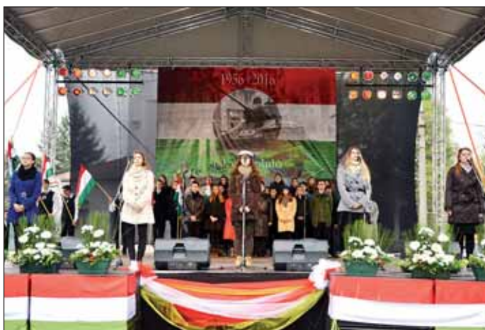
A nagykőrösi gimnazisták színvonalas műsora