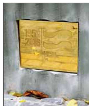
A projektet az 1956-os forradalom és szabadságharc 60. évfordulójára létrehozott Emlékbizottság 2 millió forinttal támogatta

„Éljen a magyar szabadság, éljen a hazánk!”