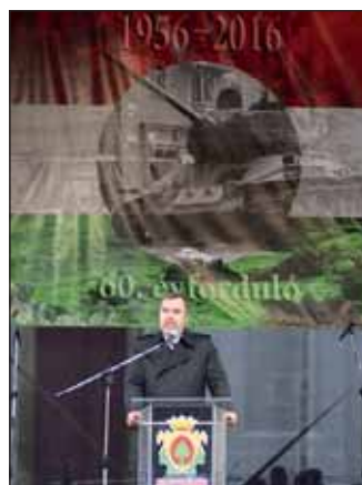
L. Simon László országgyűlési képviselő ünnepi megemlékezése