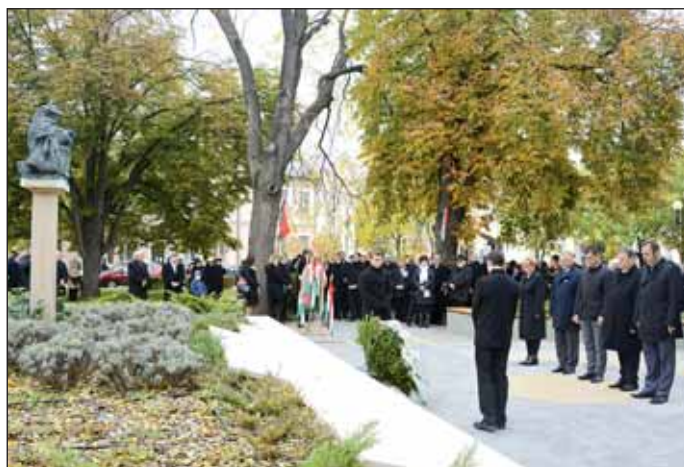
A kegyelet és a megemlékezés virágainak elhelyezése