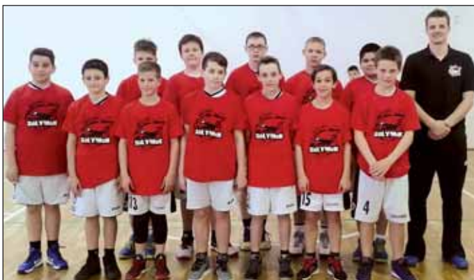
Fotó: Utasi Gabriella