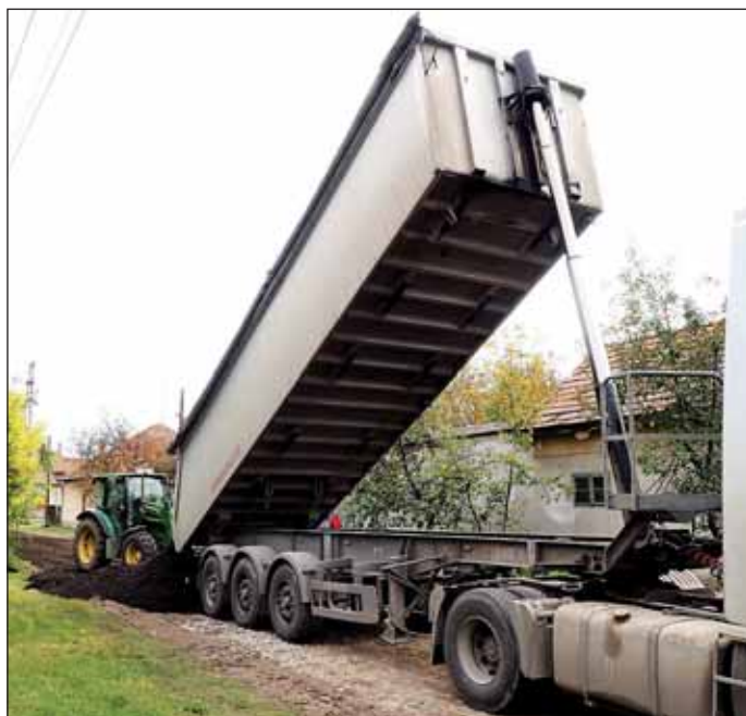
A Luther utcában éppen akkor hozták meg a mart aszfaltot

Már a mart aszfalt terítése zajlott a Krúdy Gyula és a Luther utcákban mikor a helyszínen jártunk, így biztosítva könnyebb közlekedést az ott élő nagykőrösieknek,