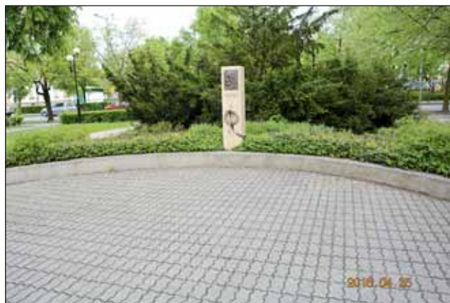
A felújítás előtt így nézett ki a térrészlet