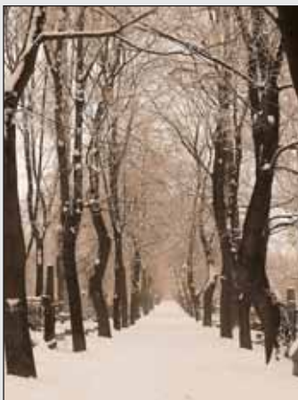
Képünk illusztráció

Hadd menjek, Istenem, Mindig feléd, Fájdalmak útjain Mindig feléd. Ó, sok keresztje van,