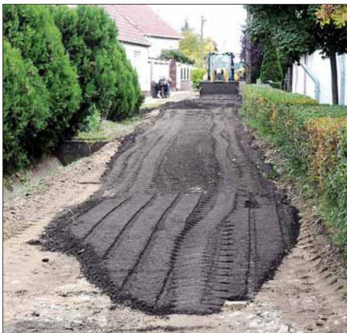
A Krúdy Gyula utcában két munkagép is dolgozott