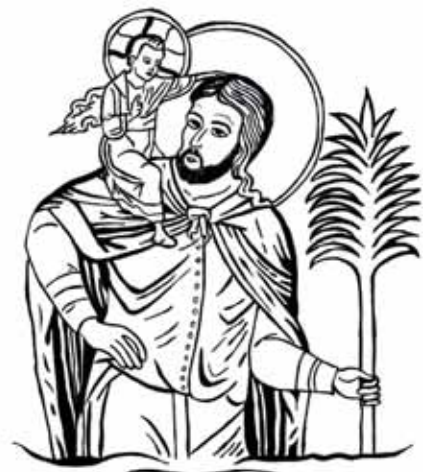
Szent Kristóf, könyörögj érettünk!

Szeretettel hívjuk és várjuk Önt és kedves Családját, hogy közösen mondjunk köszönetet Istennek az énekkar 12 éves fennállásáért.