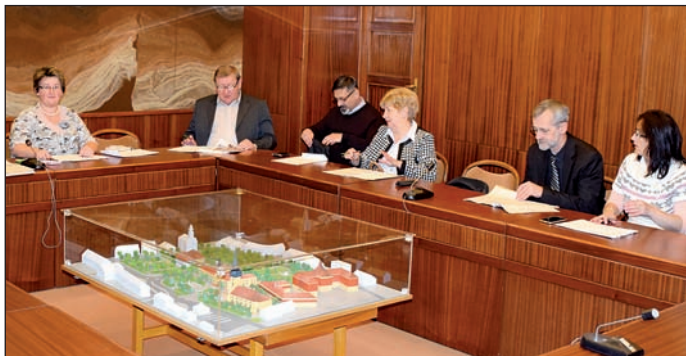
Képünk a zárt ülés előtt készült

Nagykőrösön minden érvényes pályázatot benyújtó diák, hallgató támogatásban részesült