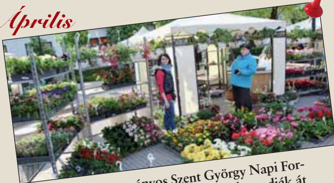
2017-ben a hagyományos Szent György Napi Forogtató és Virágvásár rendezvény keretében adják át a nagykőrösieknek a teljesen felújított Cifrakertet és a Svájci Házat