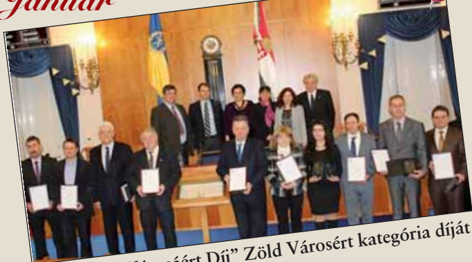
A „Holnap Városáért Díj” Zöld Városért kategória díját nyerte el Nagykőrös