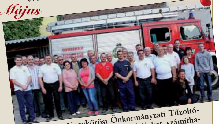
Flórián-nap a Nagykőrösi Önkormányzati Tűzoltóságban – köszönjük egész éves munkájukat, számíthatunk rájuk 2017-ben is