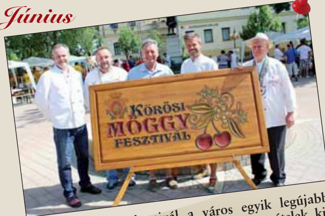
A Körösi Mogygyfesztivál a város egyik legújabb nagyrendezvénye – hatalmas tömeg, finom ételek, ki-hagyhatatlan sztárfellépők 2017-ben is

A 2016-os évet bemutató képes visszatekintő folytatását az Önkormányzati Hírek következő lapszámában tekinthetik meg!