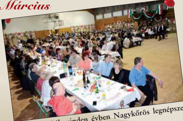
A Polgári Bál minden évben Nagykőrös legnépszerűbb, legnagyobb bálja