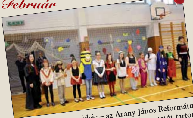
A február a farsang ideje – az Arany János Református Általános Iskola látványos és ötletes bemutatót tartott