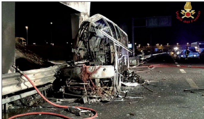
11 gyermek és 5 felnőtt halt meg a balesetben

Tizenhat halottja, egy mesterséges kómában tartott, életveszélyes állapotú, két nagyon súlyos, tíz súlyos és tizenhárom könnyű sérültje van az éjféli olaszországi, Verona közelében történt buszbalesetnek, tizenketten sérülések nélkül éltek túl a balesetet – közölte Szijjártó Péter külügyi és külügyminiszter 2017. január 21-én.