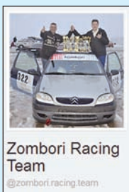
Zombori Racing Team @zombori.racing.team