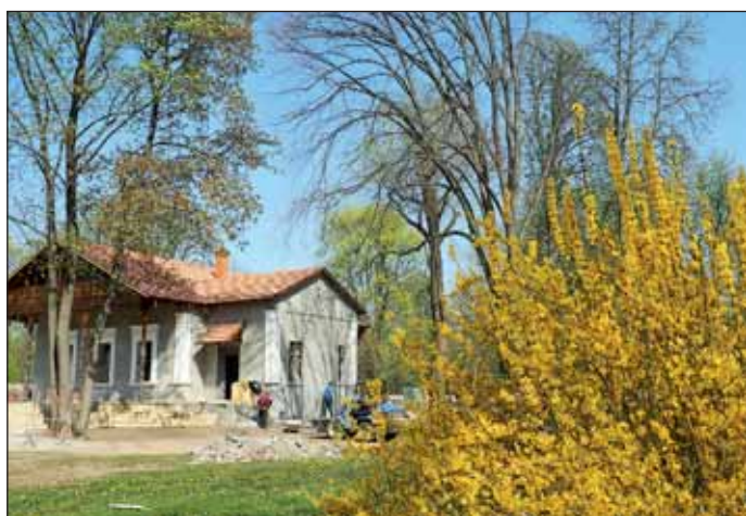
A Cifrakertben tovább folyik a terület teljes rehabilitációja, mely érinti a Svájci Házat és a Zenepavilont is