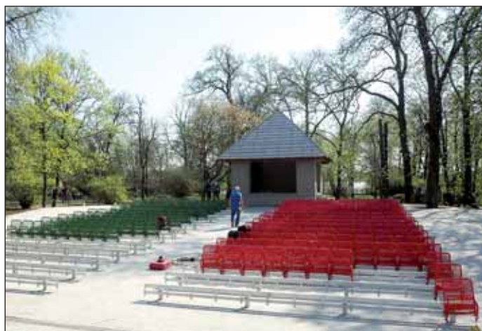
A napokban helyére kerültek a lelátó székei, melyeket Nagykőrös Város Önkormányzata pályázat útján nyert el a Puskás Stadion bontása után