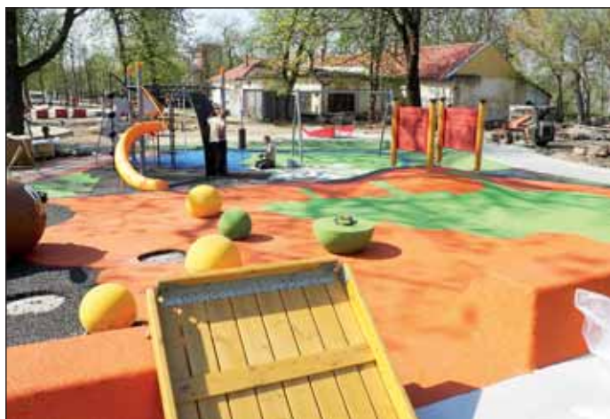
Új, korszerű játszótér és görboki pálya kerül kialakításra, és szabadtéri sporteszközöket is telepítenek