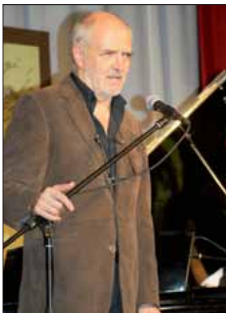
Wolf Péter, Erkel Ferenc- és Fényes Szabolcs-díjas zeneszerző

műsora is felejthetetlen percek okozott, majd Erdélyi Erzsébet operaénekes és Wolf Péter, Erkel Ferenc- és Fényes Szabolcs-díjas zeneszerző közös estje kápráztatott el mindenkit. A nem mindennapi Fináléban mindhárom kórus együttesen fellépett, és égi muzsika töltötte be a színházterem csöndjét.