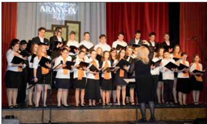
A békéscsabai Arrisus Ifjúsági Vegyeskar műsora