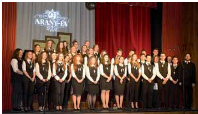
A nagykőrösi Arany János Református Gimnázium, Szakgimnázium és Kollégium Kórusa

Magyar Örökség-díjas és Ferenfvárosi József Attila-díjas kiadó producer, a Református Zenei Fesztivál igazgatója is megtisztelte jelenlétével a hangversenyt, aki elismeréssel szólt a rendezvényről, és a kőrösi gimnázium kórusáról is.