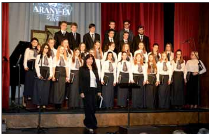
A miskolci Lévy József Református Gimnázium Vegyeskarának műsora

„A zene lelki táplálék és semmi mással nem pótolható. Aki nem él vele: lelki vérszegénységben él és hal. Teljes lelki élet zene nélkül nincs. Vannak a léleknek régiói, melyekbe csak a zene világít be.” (Kodály Zoltán: Mire való a zenei önképzőkör, 1944)