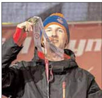
Magyar Speciális Olimpia Szövetség