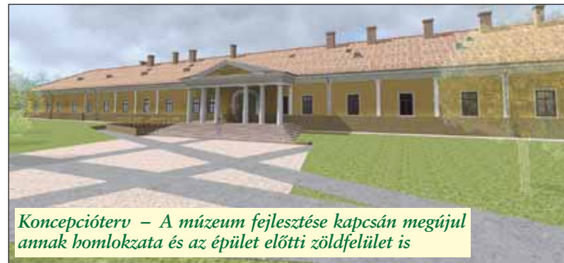
Konceptióterv – A múzeum fejlesztése kapcsán megújul annak homlokzata és az épület előtti zöldfelület is

Arany János-emlékévé, Nagykőrös, Arany János városa programsorozat keretében felújításra, átalakításra kerül az Arany János Múzeum épülete is.