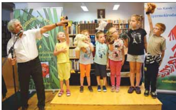
Sás Károly pedagógus, író, zeneszerző és dalszövegíró előadása