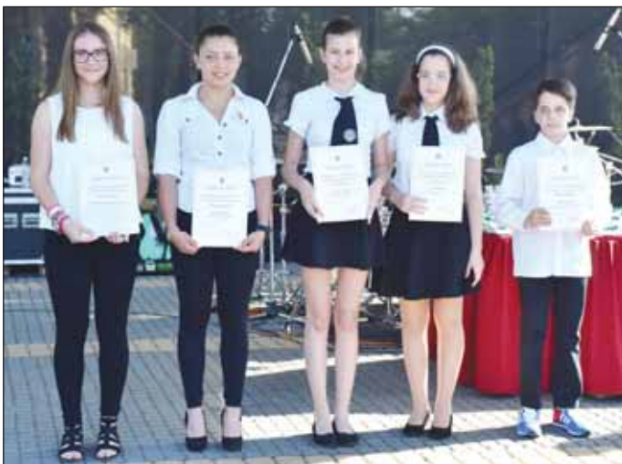
A „Jó Tanuló, Jó Sportoló” címet elnyert kiváló diákok

A tanév végéhez közeledvén az idei évben is elismerő oklevelet vehettek át a városunk iskoláiban tanuló azon diákok, akik Nagykőrös hírnevét nagyszerű