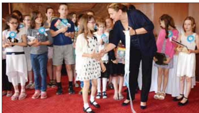
Díjazták a gyermekkönyvtár legszorgalmasabb olvasóit

Az elmúlt héten, Nagykőrösön a könyveké volt a főszerep a Nagykőrösi Arany János Kulturális Központ szervezésében, a Deák téren filléres könyvvásárra és könyvadásra is lehetőség nyílt.