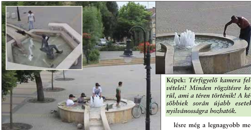
Képek: Térfigyelő kamera felvételei! Minden rögzítésre kerül, ami a téren történik! A későbbiek során újabb esetek nyilvánosságra hozhatók.

Tiltott a szökőkútban fürdőzés és egyben nagyon ártalmas lehet az egészségünkre. Országszerte másodfokú hőségriasztás van érvényben, a melegben hűsítő pancsolásra csábítanak a csobogó szökőkutak, de a tisztifőorvos arra figyelmeztet, hogy a díszkútakban való fürdés vagy abból való ivás egészségügyi kockázatot jelent és minden esetben tilos! A városi szökőkutak vize nem minősül fürdővíznek, így mikrobiológiai és kémiai szempontból nem ellenőrzött. A szökőkutak vize a bennük lévő vegyi anyagok mennyiségétől füg-